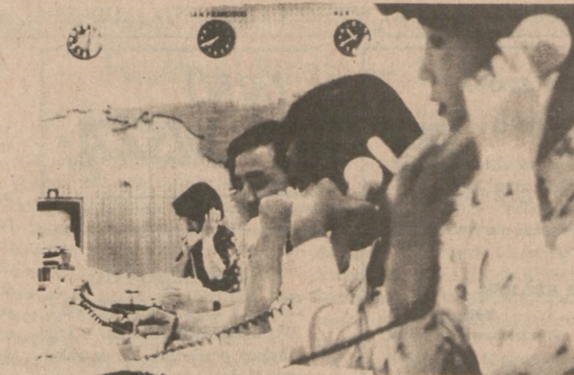
TOKIO, Japonia — Zapracowani urzędnicy Banku Tokijskiego notują kurs waluty zagranicznej. W sierpniu doszło tu do ponownego spadku wartości dolara.

Braknie nam tu słów zdolnych wyrazić nasz stosunek do tego, co zobaczyliśmy i usłyszeliśmy w Zbrozsy. Mammy chyba jednak prawo, nie tylko prawo, ale społeczny obowiązek zwrócić się do Wojewódzkiego Związku Kółek Rolniczych w Radomiu i tamtejszego Wydziału Rolnictwa Urzędu Wojewódzkiego z pytaniem: kto ponosi odpowiedzialność za taki stan rzeczy?