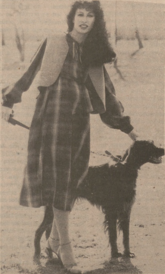
Wygodny strój dla przyszłej matki.