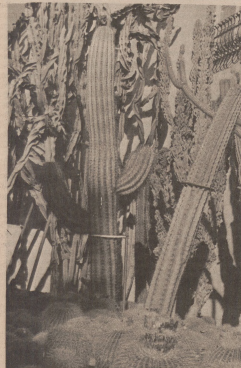
Tropikalna egzotyka: największy park egzotyczny w USA — 40 akrów kwadratowych.

nym sopranem duet z "Poławiacy perel" z największą sławą naszych czasów, ze słynnym Caruso. Zawdzięczając "wspaniałej miękkości głosu oraz jego siłę" — jak pisał w r. 1922 "New York Herald" — Walska odnosi triumfy na scenach operowych w Ameryce i Europie. Występuje m.in. w Nowym Jorku, Chicago, Filadelfii, Detroit, a także w Paryżu, Wiedniu i Nicei. Świat podziwiał ją w czołowych rolach oper "Madame Butterfly", "Manon", "Traviata", "Rigoletto", "Lamke", "Tosca",