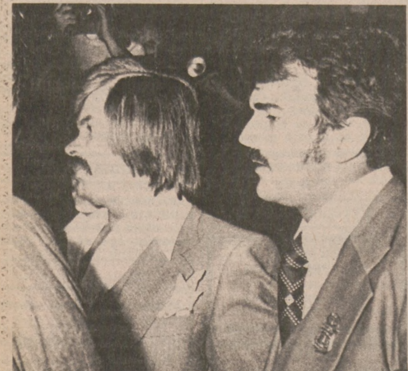
CHICAGO — Policja prowadzi dwóch Chorwatów, którzy wtargnęli do tutejszego konsulatu NRF i żądali uwolnienia ich rodaka, który przebywa w więzieniu zatrzymany przez władze niemieckie, za zamach na jugosłowiańskiego dygnitarza. Terroryści poddali się policji chicagowskiej po kilku godzinach przetrzymywania zakładników. (UPI)

Davis, który zastrzelił policjanta, będzie odpowiadał jedynie za posiadanie niezarejestrowanej broni. Zdaniem władz strzelanie w obronie własnej było zupełnie uzasadnione.