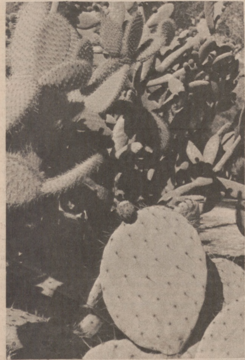
Kilka gatunków roślin tropikalnych z różnych stron świata.

Pewien farmer spod Narbonne w pld. Francji był burzony, że pobliską plażę zaokupowali nudysci. Założył ogrodzenie z drutu kolczastego, ale to nie pomogło. Wobec tego wypuścił na nudystów wielkiego byka. To pomogło — plaża opustoszała.