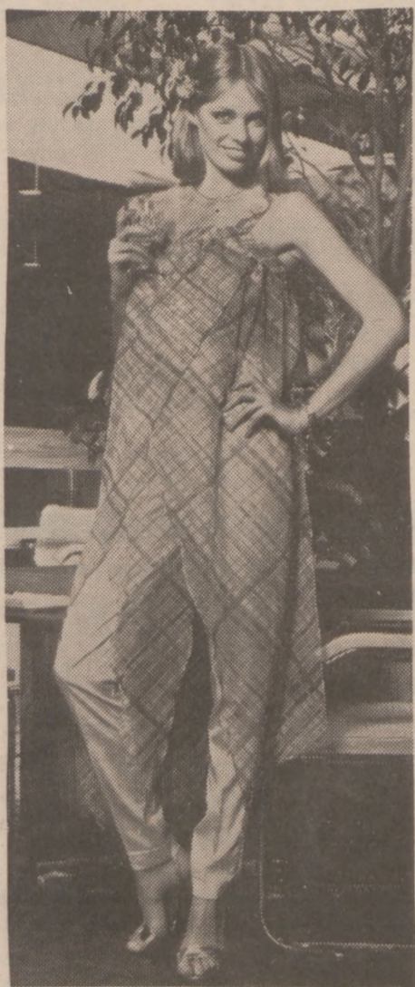
"Spodnium" z cienkiego, przewiewnego materiału.