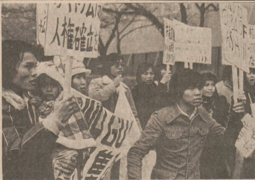
TOKIO. — Emigranci z Wietnamu, mieszkający w stolicy Japonii, demonstrują przeciw planowanej wizycie w Japonii premiera wietnamskiego Nguyen Duy Trinh.