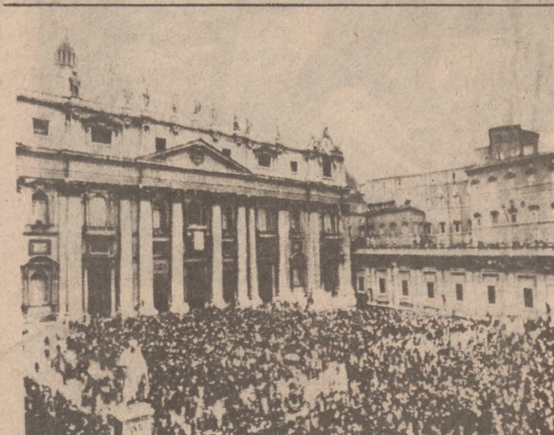
WATYKAN. — Plac Św. Piotra w dniu Bożego Narodzenia. Tysiące wiernych czekają na błogosławieństwo papieża.

Jedną z nich jest zasada, że obywatel węgierski może składać podanie o paszport zagraniczny tylko co trzeci rok, drugą — ograniczenia dewizowe, dopuszczając kwotę $170 dolarów dla turysty węgierskiego wyjeżdżającego na Zachód.