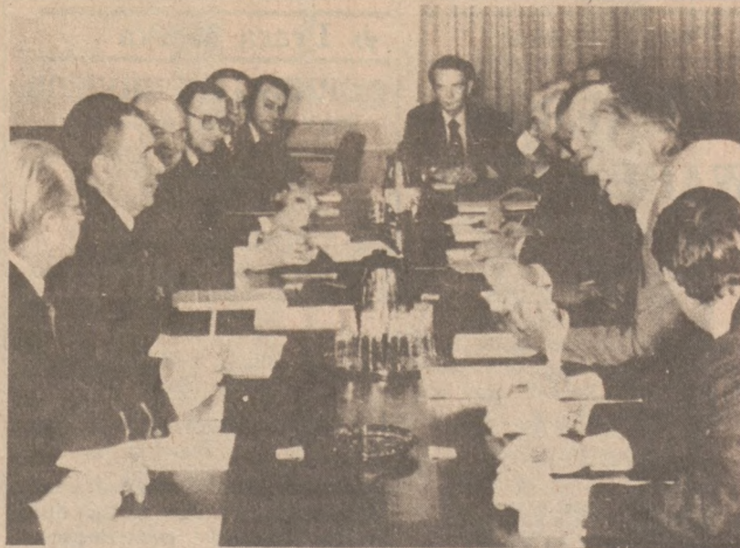
GENEWA. — Sekretarz stanu Cyrus Vance przewodniczył delegacji amerykańskiej, która brała udział w rozmowach SALT II z delegacją sowiecką.

Obydwa morderstwa zostały dokonane w miejscach odległych od siebie niecałe dwie mile. Ogólna ilość zabójstw taksówkarzy na terenie miasta w 1978 roku wyniosła 8, dwa ostatnie zabójstwa zwiększyły tą liczbę.