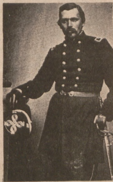
Colonel Wladimir Krzyżanowski, c. 1861.

ALLIANCE PRINTERS and PUBLISHERS 1201 N. MILWAUKEE AVENUE CHICAGO, ILLINOIS 60622