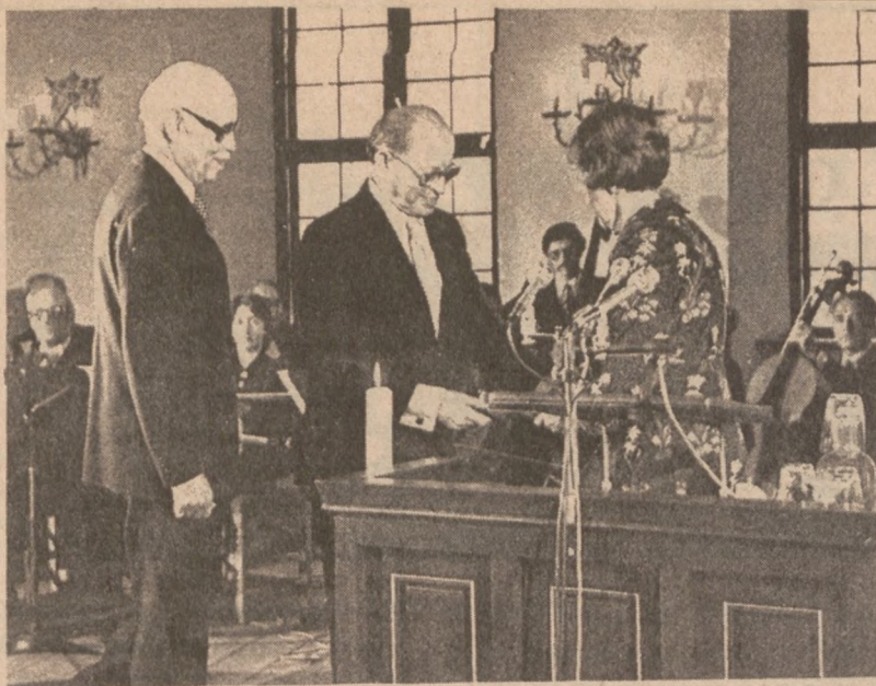
OSŁO. — Premier Izraela Menachem Begin podczas ceremonii wręczenia mu pokojowej nagrody Nobla.

OBSZERNE informacje przeczytasz i najlepsze zdjęcia zobaczysz w Dzienniku Związkowym.