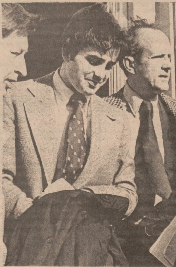
HAMMOND, Ind. — William Kampiles, lat 24, wychodzi z sądu po skazaniu go na 40 lat pozbawienia wolności za sprzedaż tajnych dokumentów amerykańskiego satelity sowieckiemu agentowi za 3,000 dolarów.

Również możliwość przewartościowania pewnych pojęć. Np. — czego na dole nikt nie zrozumie — normalność tam na górze zaczyna mieć spotyknięcie wysoką cenę. Bo szklanka herbaty na wierzchołku smakuje zupełnie inaczej niż w domu. Uścisk dłoni nie jest taki jak na dole — zdawkowy, a jest gestem przyjaźni, podziękowania za wspólny trud.