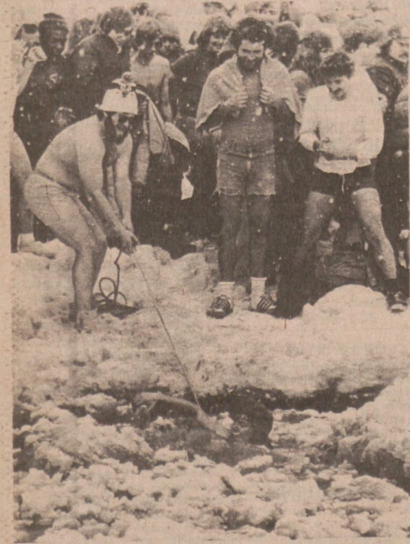
MILWAUKEE. — Członkowie klubu "Niedźwiedzi polarnych" kąpią się w jeziorze Michigan.

w czwartek, ponieważ nie otrzymał żadnej odpowiedzi ze strony mieszkańców na pukanie i wołanie o otworzenie drzwi, udał się na policję. Policja, która wdarła się do wnętrza domu odnalazła ciała zamordowanych w kałużach krwi. Earl'a Teets, poddano natychmiast przesłuchaniom, które doprowadziły do wykluczenia go z kręgu podejrzanych. Przyjaciele i sąsiedzi, którzy zebrali się wokół domu po tragicznym odkryciu, powiedzieli, że zabici należeli do najbardziej uczynnych ludzi w tym rejonie i że nie nasuwają im się żadne motywy popełnionej zbrodni. Policja, która początkowo stwierdziła brak jakichkolwiek śladów naprawdzających na rodzaj użytej broni, odmówiła w późniejszym czasie komentarzy na ten temat dla dobra śledztwa.