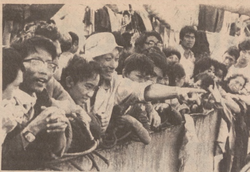
MANILA. — Wietnamscy uchodźcy na pokładzie statku panamskiego w pobliżu Zatoki Manilskiej.

Moskwa (UPI) — Sowiecka "Prawda" oceniła, że ostatnie spotkanie szczytowe przywódców czterech państw zachodnich na Gwadelupie doprowadziło do zgodnej oceny, że świat potrzebuje nowego traktatu o ograniczeniu zbrojeń, natomiast nie doprowadziło do uzgodnienia wielu innych problemów.