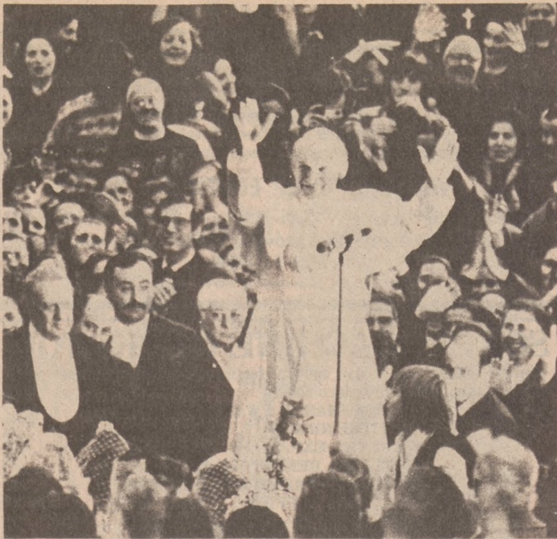
WATYKAN. — Papież Jan Paweł II podczas tygodniowej audiencji ogólnej.