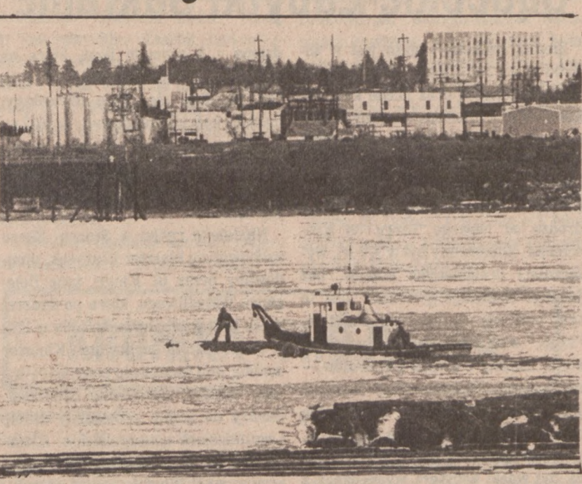
PORTLAND, Ore. — Na skutek długotrwałych mrozów rzeka Columbia pokryła się lodem po raz pierwszy od 40 lat.