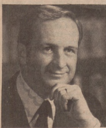
DR CHESTER WILK

Zabiegi chiropraktyczne polegają na tym, że między innymi stosuje się terapię manipulacyjną mającą na celu poprawę układu strukturalnego, aby przez to samo polepszyć funkcjonowanie całego organizmu. Mają one również na celu poprawę postawy