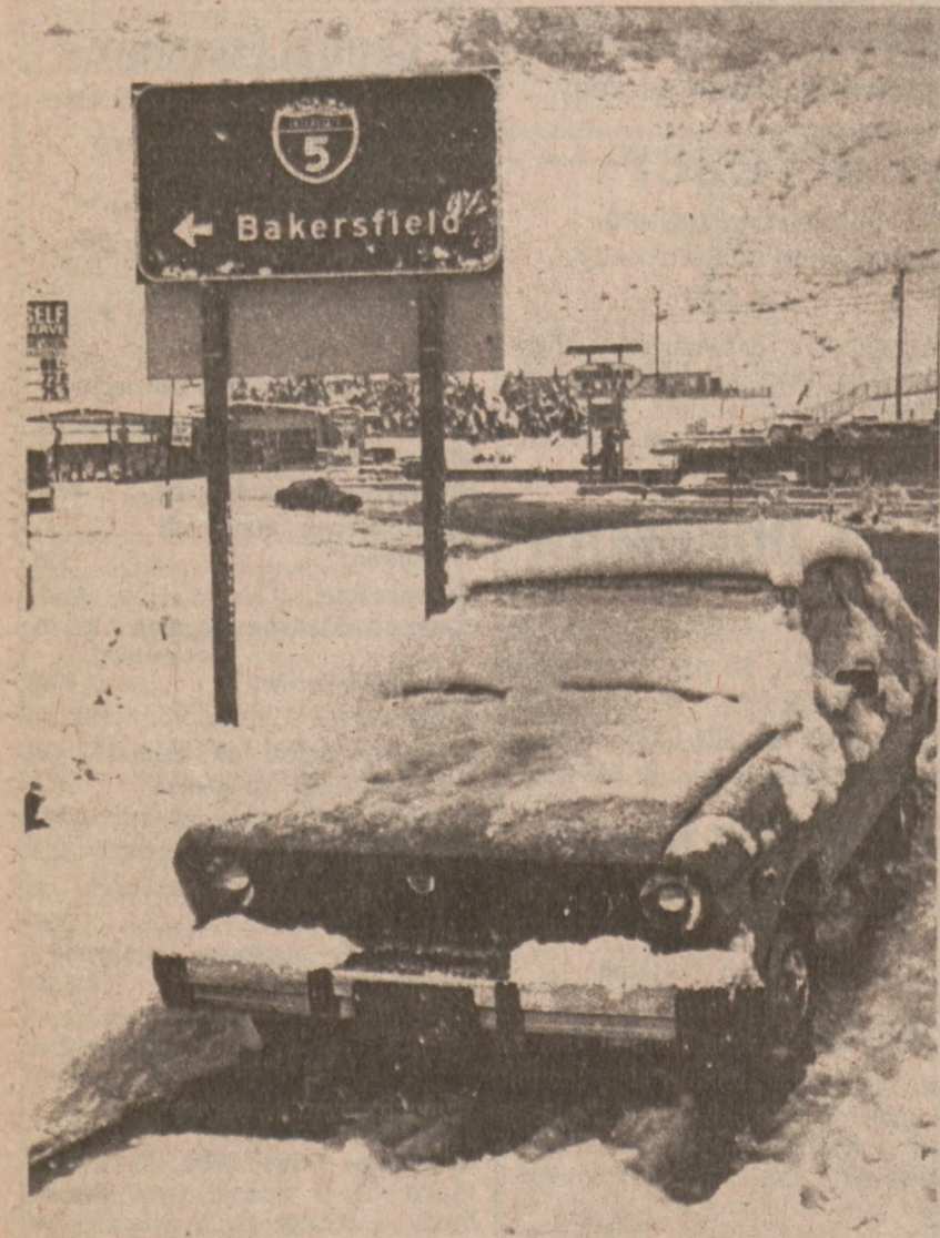
GORMAN, KALIF. — Podczas śnieżycy kierowca zdecydował się porzucić swój samochód przy wjeździe na autostradę w górskim rejonie Kalifornii.

Ofiarę przewieziono do szpitala, gdzie stwierdzono oparzenia trzeciego stopnia, które dotknęły 35 proc. ciała Harmona. Policja nie natrafiła na ślady sprawy podpalenia.