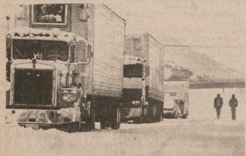
LEBEC, KALIFORNIA. — Podczas niespodziewanie dużych opadów śniegu wiele samochodów zostało porzuconych przez kierowców na drogach.

Proponowana przez Thompsona propozycja zakupu systemu komputerowego, pozwalającego na sporządzenie łatwo dostępnego i każdej porze kartoteki poszkodowanych dzieci i ich prześladowców, będzie dyskutowana osobno przez stanowy komitet do specjalnych wydatków.