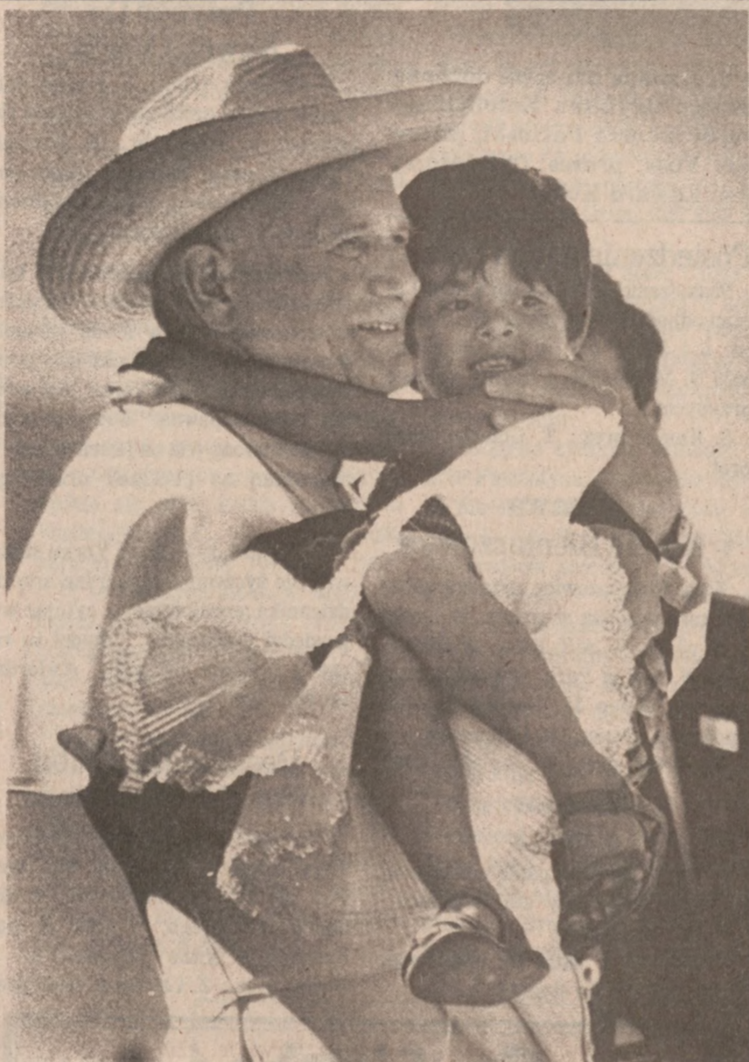
CULAPAM, MEKSYK. — Papież podczas wizyty w wiosce indiańskiej. (UPI)

Bangkok (UPI) — Nowi władcy Kambodży podali wiadomość o utworzeniu pierwszego ośrodka re-edukacyjnego (czytaj: obozu koncentracyjnego), dla dygnitarzy z poprzedniego reżymu.