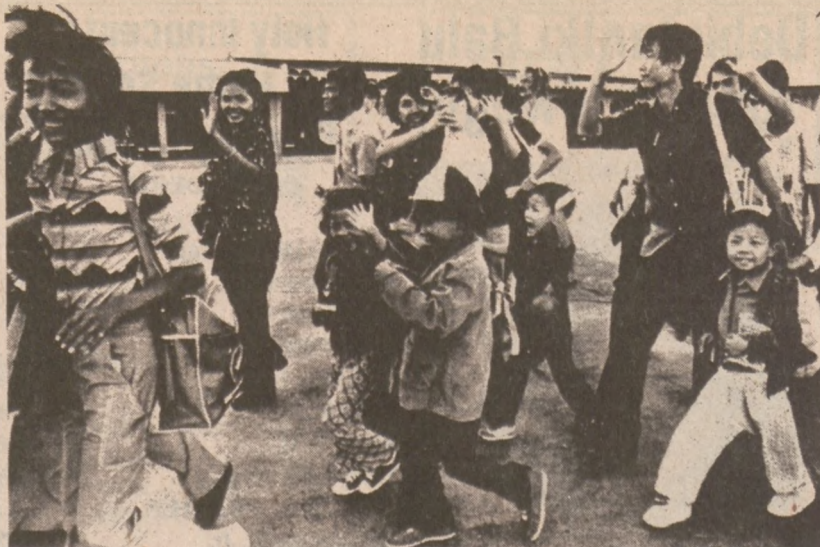
MANILA. — Grupa uchodźców wietnamskich przed odlotem do Izraela, gdzie przyznano im prawo pobytu.

Prosimy nie nadsyłać kwiatów. Pogrzebem zajmuje się: Zakład Pogrzebowy B. F. Malec i Synowie. Telefon 774-4100. (8, 9)