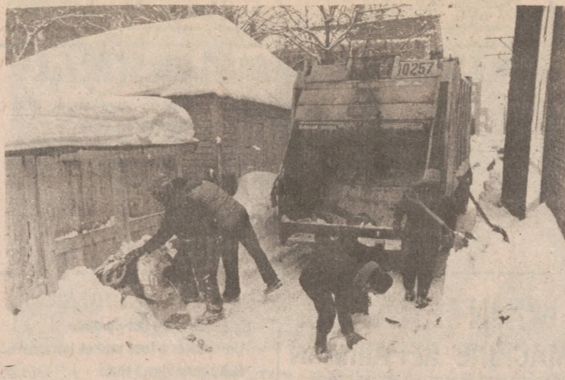
Pracownicy wydziału oczyszczania miasta odgarniają śnieg i zbierają śmieci w pobliżu skrzyżowania ulic Bosworth i Blackhawk.

Właściciele domów, bądź dozorczy usuwając śnieg z dachów blokują ponownie wiele dróg używanych przez śmieciarzy. Wydział oczyszczania miasta apeluje do mieszkańców Chicago o pomoc w usuwaniu śniegu z otoczenia domów.