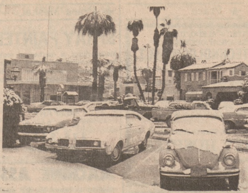
PALM SPRINGS, KALIFORNIA. — Burza śnieżna spowodowała zamknięcie kilku dróg w Kalifornii.

Przebudowa urzędów w pobliżu skrzyżowania ulicy 71 i South Shore Drive zostanie zakończona do 1980 roku. Powstanie tam 400 nowych apartamentów.