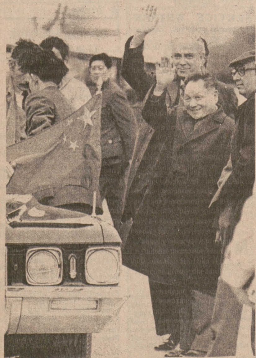
Ellington AFB., TEXAS. — Wicepremier Teng Hsiao-ping podczas zwiedzania stanu.

Policja przypuszcza, że samochód mógł najeżdżać na jakiś przedmiot na drodze, co stało się przyczyną wypadku. Nie było świadków wypadku.