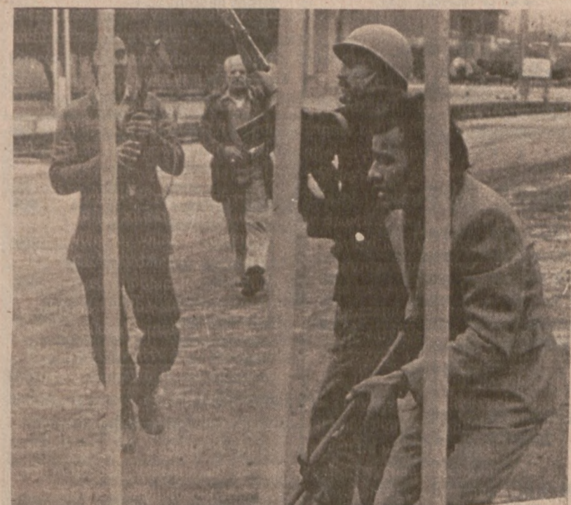
TEHERAN. — Walki między zwolennikami Khomeiniego i gwardią narodową lojalną wobec szacha. (UPI)

Wystawa około 100 obrazów Jacksona Pollocka zostanie otwarta w galerii Alfrede Smarta na uniwersytecie Chicago 14 marca. Na wystawie zostanie pokazanych wiele obrazów, które dotąd nie były wystawiane.