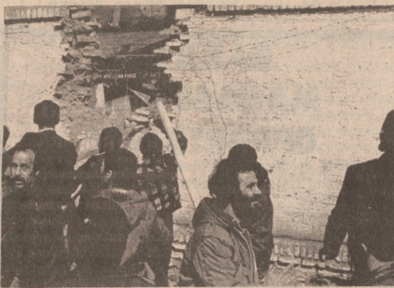
TEHERAN. — Zwolennicy Khomeiniego wdarli się na teren bazy armii irańskiej, w której znajdowały się amerykańskie urządzenia wojskowe.

Rok temu zwykła benzyna kosztowała w powiecie Cook 68.4¢ za galon, zaś benzyna wysokooktanowa 75.3¢ za galon.