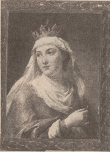
Królowa Jadwiga (1374-1399)

Cykl z Pokoju Marmurowego był też wzorem dla medali wybitych