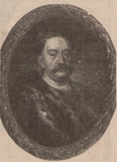
Jan III Sobieski (1624-1696)

Dzięki swym talentom organizacyjnym stał się najbardziej zaufanym współpracownikiem i pełnomocnikiem króla w sprawach artystycznych, co znalazło formalne potwierdzenie w powierzeniu mu głównego stanowiska w Komisji Budowli Królewskich w r. 1777 i mianowanie go w roku 1784