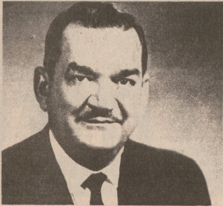
Kongresman Klemens Zabłocki.

Milwaukee, Wis. (Inf. wł.) — Wybitny kongresman polskiego pochodzenia, Klemens Zabłocki z Milwaukee, Wis., przewodniczący Izbowego Komitetu Spraw Zagranicznych i wychowanek Uniwersytetu Marquette (alumn z 1936 r.), został uhonorowany przez tę uczelnię, otrzymując wyróżnienie "1979 Alumnus of the Year".