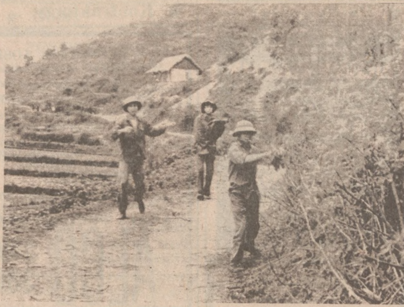
PROWINCJA LANG SON, WIETNAM. — Żołnierze wietnamscy usuwają druty telegraficzne w terenie objętym walkami z atakującymi oddziałami chińskimi.

Podobnie jak w pobliżu Lincoln Park zniszczenia zanotowano także przy Rainbow Beach. Policja rozpoczęła poszukiwania sprawców zniszczeń i kradzieży oraz właścicieli pojazdów, apelując jednocześnie do mieszkańców miasta, którzy nie wiedzą do tej pory gdzie został zaparkowany ich samochód po usunięciu go z ulicy, o zgłaszanie się do komend.