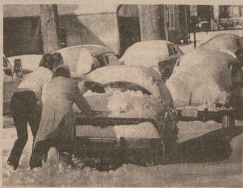
RICHMOND, VA. — Znaczne opady śniegu (ponad 10 cali) sprawiły wiele kłopotów kierowcom.

W ciągnięciu loterii stanowej wylosowano następujące numery: W grze Big Pay Day 844 25 5 8108 W grze Treasure Hunt 32 23 31 06 39 45