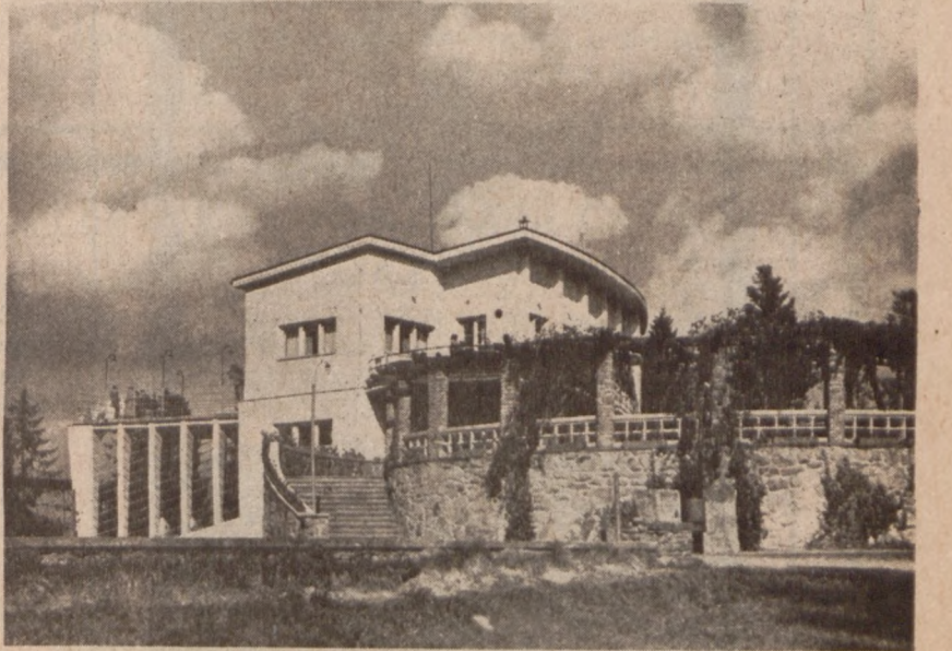
Krynica — Restauracja na Górze Parkowej

Prospekty wiosennego sezonu koncertowego w Royal Festival Hallu, wraz z zapowiedzią pierwszego wykonania dzieła Panufnika, już się ukazały.