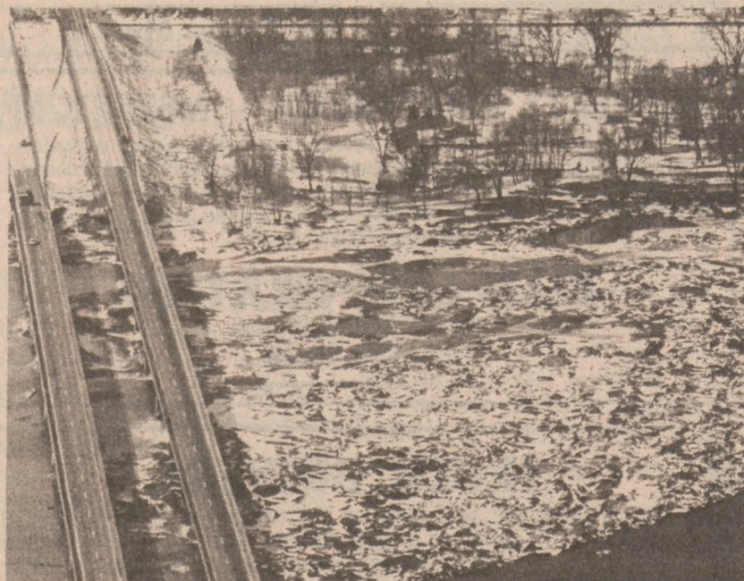
ASHLAND, NEB. — Łódź zebrany na rzece Platte spowodować może zalanie pobliskich terenów. Ostrzeżenie przeciwpowodziowe zostało wydane w rejonie miasta Ashland.

Podobna sytuacja zaistniała w latach sześćdziesiątych. Na początku lat siedemdziesiątych był natomiast nadmiar nauczycieli.