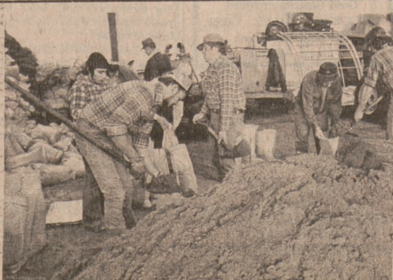
MILAN, ILL. — Ochotnicy i pracownicy urzędów miasta napelniają worki piaskiem. Będą one użyte do utworzenia wału przeciwpożarowego. (UPI)

Pracownicy biura statystycznego odwiedzą w tym miesiącu około 1,300 budynków w celu zebrania danych statystycznych na temat warunków mieszkalnych w Chicago. Do roku 1980 pracownicy urzędu będą co miesiąc odwiedzać około 1,500 domów. Dane statystyczne dotyczące warunków mieszkalnych stanowią ważne źródło dla badań nad ekonomicznym rozwojem w kraju.