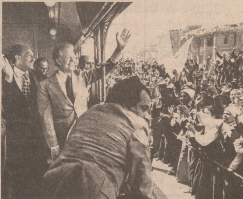
ALEKSANDRIA, EGIPCI. — Prezydent Carter i prezydent Egiptu Anwar Sadat pozdrawiają Egipcjan zebranych na jednej ze stacji, przez którą przejeżdżał ich pociąg.