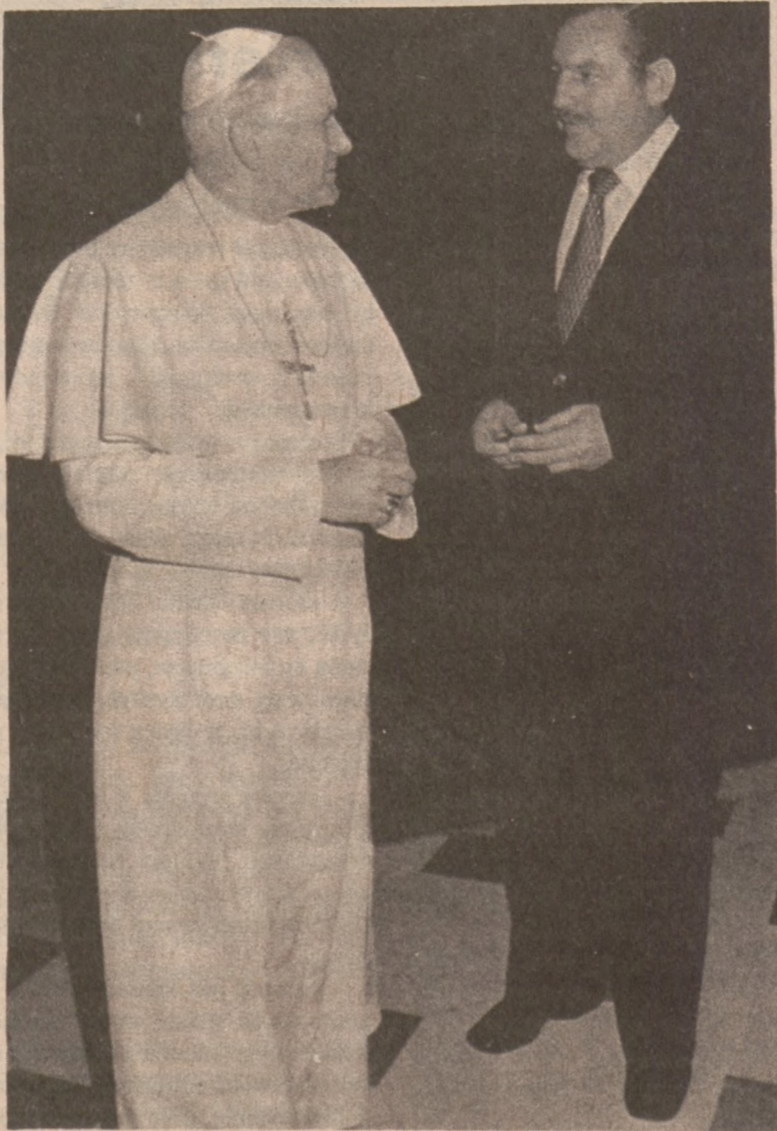
WATYKAN. — Minister spraw zagranicznych Południowej Afryki Roelof Botha podczas rozmowy z Papieżem Janem Pawłem II-gim.

Pamiętaj, że wobec zmuszenia narodu polskiego do milczenia, "Dz. Związkowy" jest jego wolnym głosem.