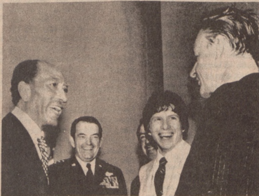
KAIR. — Prezydent Egiptu Anwar Sadat spotkał się z Zbigniewem Brzezińskim. Obecny był też syn prezydenta Cartera

Rzym. — Dziś nad ranem, wskutek ogólnego porażenia i bez odzyskania przytomności zmarł wicepremier włoski, przywódca małej partii republikańskiej, 75-letni Ugo La Malfa.