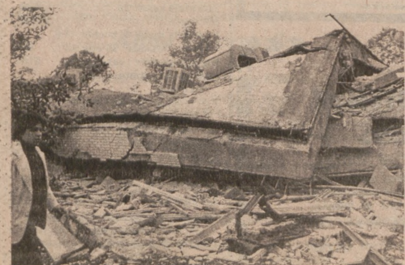
MEXICO CITY. — Trzęsienie ziemi zniszczyło wiele budynków w mieście.

Dyrektorzy przedsiębiorstw, które zanieczyszczają środowiska naturalne będą osobiście odpowiedzialni za brak odpowiednich instalacji w fabrykach zatrzymujących trujące substancje. Będą oni pociągani do odpowiedzialności osobiście, gdyż jak wykazuje doświadczenie, dotąd koszty zanieczyszczeń pokrywane były przez konsumentów i właścicieli akcji.