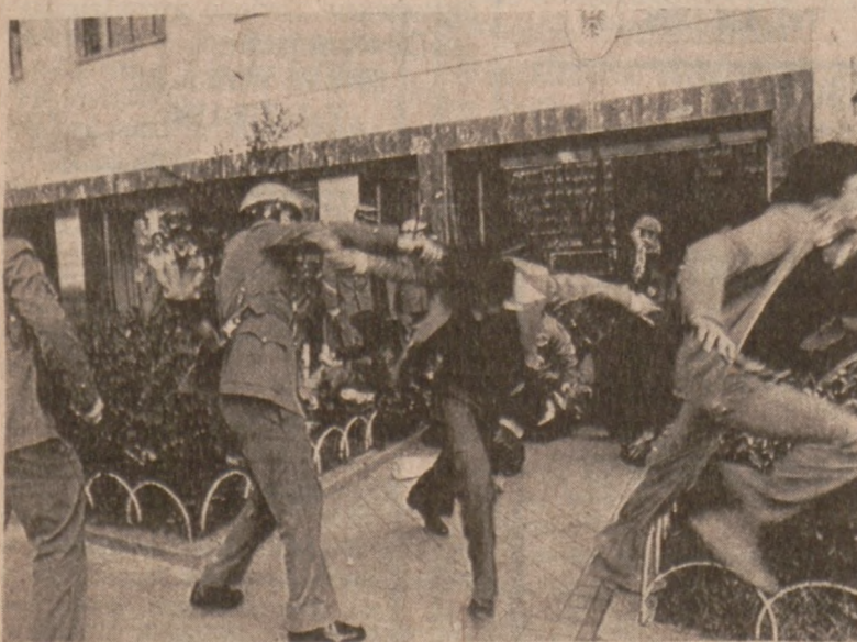
MADRYT. — Palestyńscy studenci demonstrowali przeciw podpisaniu traktatu egipsko-izraelskiego przed budynkiem Ligi Arabskiej. (UPI)

W Chicago powstała nowa orkiestra symfoniczna. Członkami jej są muzycy z Opery Lyrycznej. W programie, który będzie realizowany w najbliższym czasie orkiestra wykonywać będzie utwory operowe, dzieła Mozarta i Brittena oraz utwory muzyki lekkiej, tzw. muzyki Broadway'u.