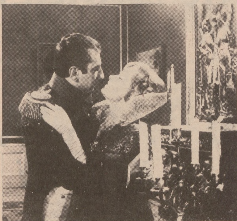
Gustaw Holoubek i Beata Tyszkiewicz

Według historycznej prawdy, Warszawa wspaniałym balem wita cesarza Francuzów w filmie "Marysia i Napoleon" w kolorach i na szerokim ekranie. Uroczyste arcydzieło filmowe, lekkie i pogodne, pełne wykwitnego humoru i co ważniejsze... aktorów doskonałych!