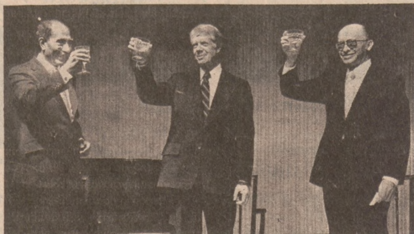
WASHINGTON. — Prezydent Carter, prezydent Sadat i premier Begin podczas uroczystej kolacji w Białym Domu po podpisaniu traktatu egipsko-izraelskiego.

Punktem wyjścia w tym względzie była sprawa Sandburg Village, które ma być przekształcone na kondominia.