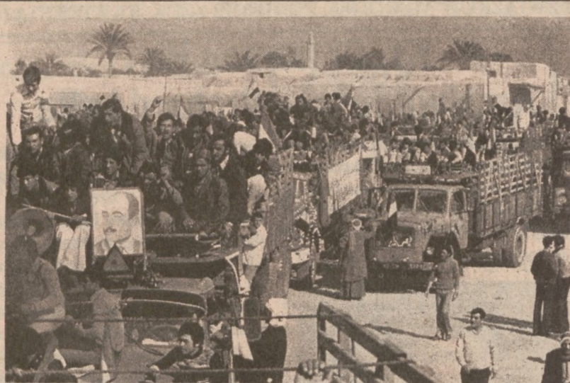
EL ARISH, SYNAJ. — Arabowie demonstrują radość z powodu podpisania traktatu izraelsko-egipskiego, na mocy którego okupowana część Synaju zostanie zwrócona Egiptowi. (UPI)

Radio teherańskie informuje, że na rozprawę przed "sądem rewolucyjnym" w samym tylko Kermanshahu czeka 47 osób, oskarżonych o korupcję, udział w masowych mordach i współdziałanie z reżymem szacha.