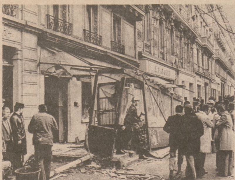
PARYŻ. — Wybuch bomby podłożonej przez terrorystów arabskich zniszczył żydowski ośrodek studencki. 26 osób zostało rannych.

Wprawdzie oficjalne statystyki głoszą, iż liczba napadów na nauczycieli spadła — drugi już rok z kolei. W ub. r. zanotowano takich wypadków 1,042. Healey twierdzi jednakże, iż jedna trzecia wszystkich napadów na nauczycieli nie jest podawana do wiadomości władz.