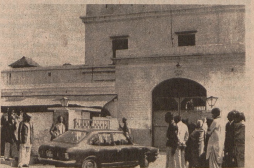
RAWALPINDI, PAKISTAN. — Grupa osób zbiera się na placu przed więzieniem, gdzie powieszony został były premier Zulfikar Ali Bhutto.