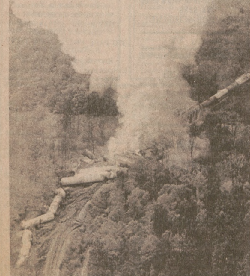
MILLIGAN, FLA. — Dym unosi się z rozbitych wagonów, które przewożyły trujące substancje.

W niedzielę woda przerwała tamę w pobliżu Meredosia, zalewając obszar 12,000 akrów ziemi rolnej i drogi stanowe — Illinois 104 i 99.