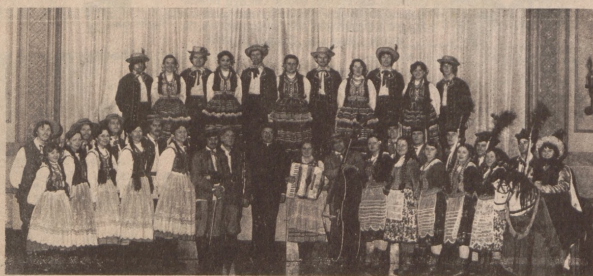
Zespół Pieśni i Tańca "Rzeszowiacy"

Istnieją podejrzenia, że Mori zabił dziewczynę "z miłości", ponieważ ta nie podzielała jego uczuć.