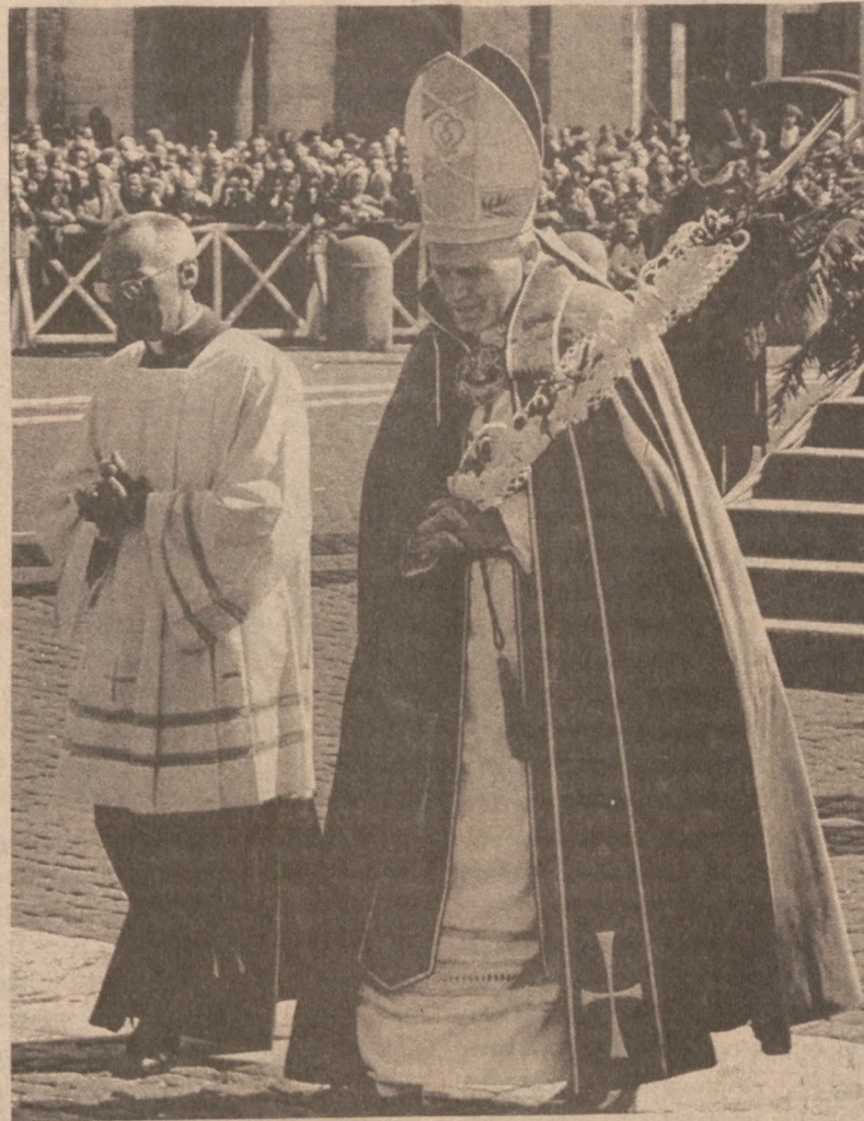
WATYKAN. — Papież Jan Paweł II odprowadził Mszę św. w Niedzielę Palmową przy polowym ołtarzu na placu św. Piotra.

Jedynie w Dubrowniku, słynnym uzdrowisku nadmorskim, straty są stosunkowo niewielkie. W mieście tym uszkodzonych zostało tylko kilka starych domów.