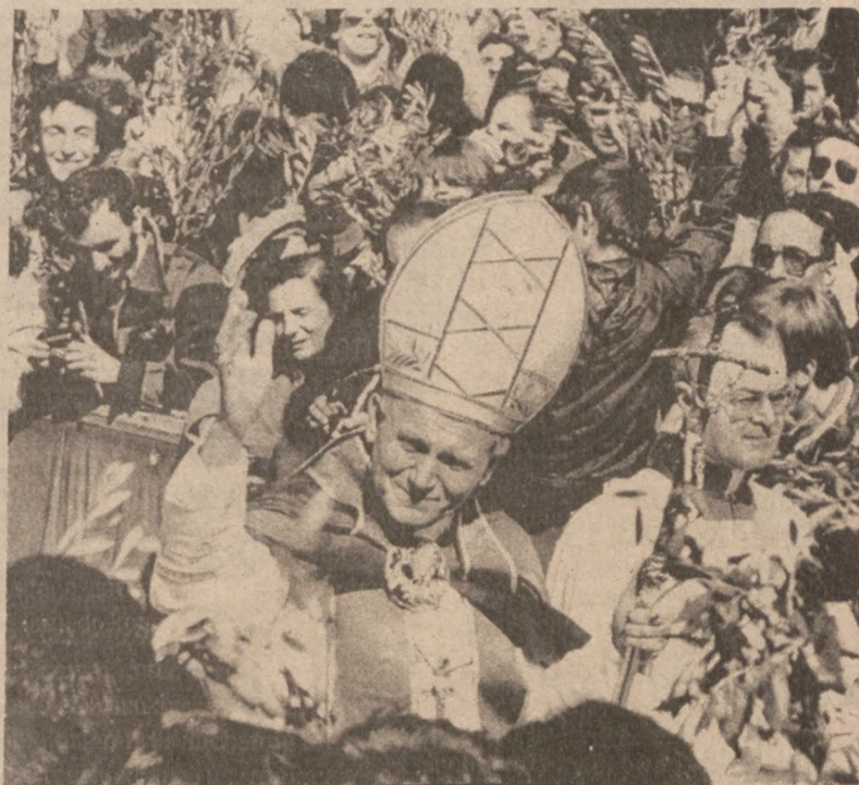
WATYKAN. — Papież Jan Paweł II przechodzi wśród wiernych zebranych na placu św. Piotra, gdzie odprawił Mszę św. w Niedzielę Palmową.