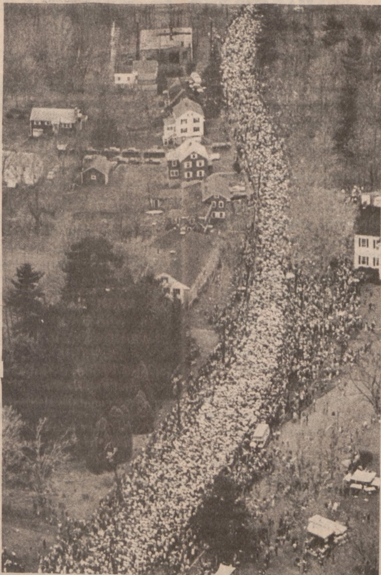
HOPKINTON, Mass. — 7800 biegaczy wzięło udział w 83 mara-tonie z Hopkinton do Bostonu. Odległość między miastami wynosi 26 mil.