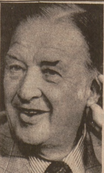
Henry Ford spotkał się z prezydentem Francji Giscardem d'Estaing aby przedyskutować plan budowy fabryki samochodów Forda na terenie Francji