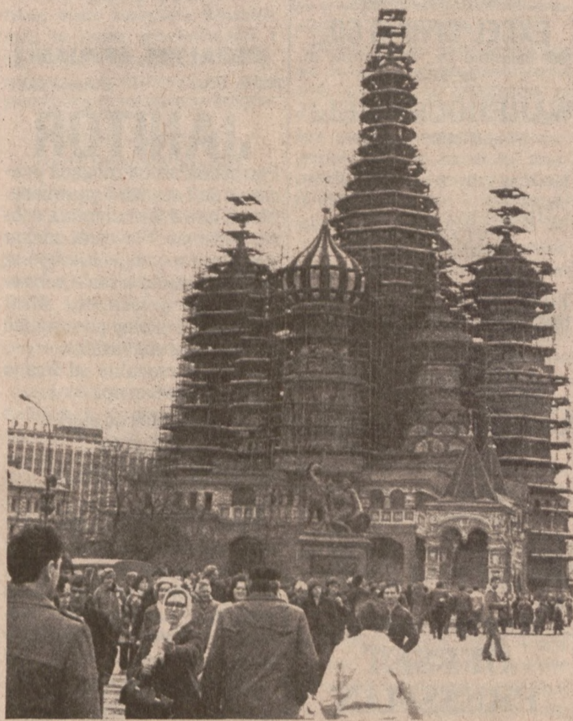
MSKWA. — Bazylika błogosławionego Wasyla odnawiana jest przed olimpiadą.