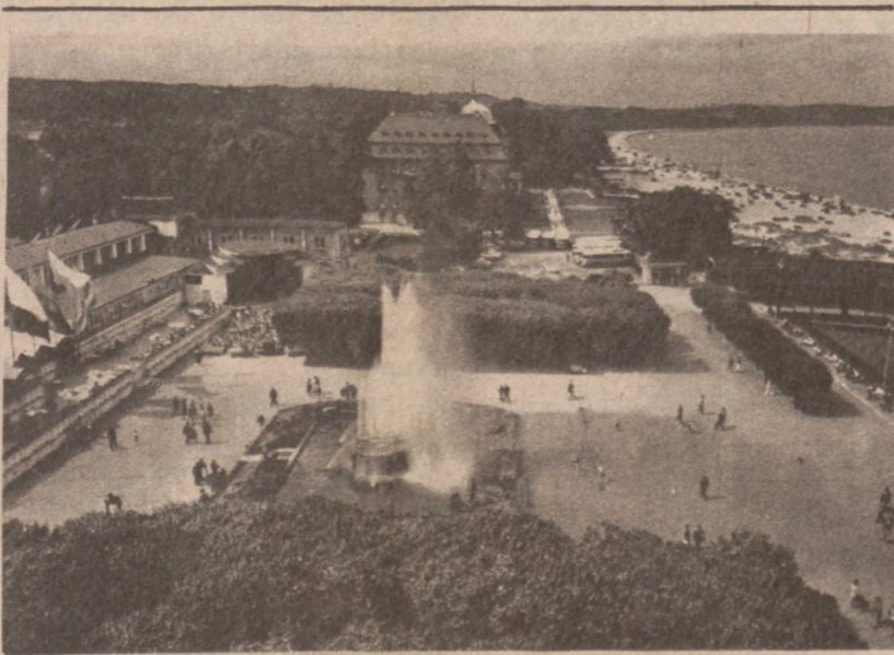
SOPOT. — Skwer przed wejściem na molo, w głębi Grand Hotel.

Carter powiedział, że mimo cierpienia aktor znajduje się w dobrym humorze i nie traci nadziei. Aktor prosił Prezydenta o przekazanie wszystkim serdecznych podziękowań za tysiące listów i dobrych życzeń, które odbiera codziennie od swoich wielbicieli.