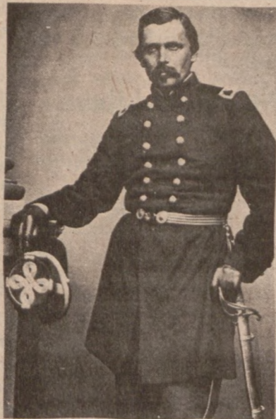
Cisnel Wladimir Krzyzanowski, c. 1861.