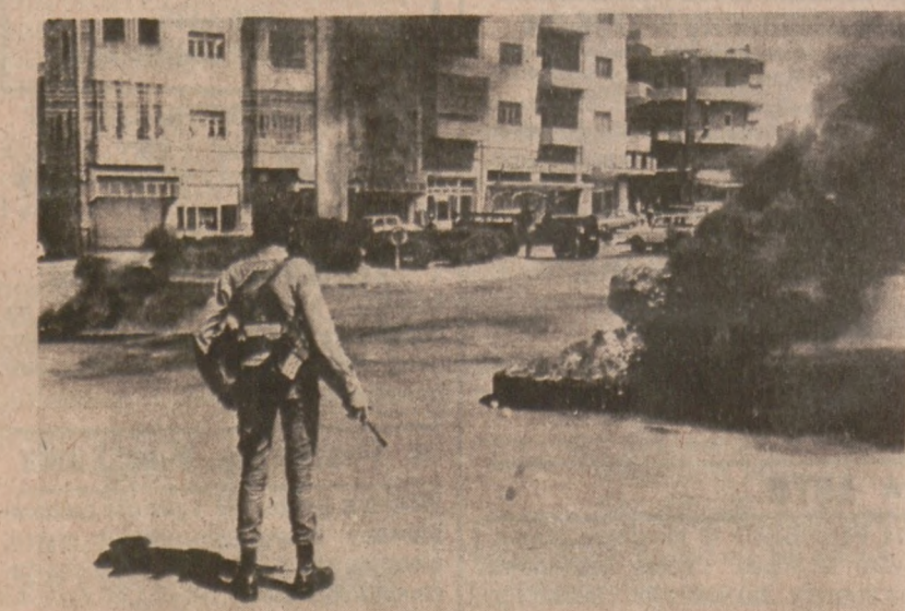
RAMALLAH, okupowany przez Izrael zachodni brzeg. Arabowie podpalili opony samochodowe w rocznicę uzyskania niepodległości przez Izrael.

Pani mayor oświadczyła niedawno, iż przy zbiorowym wysiłku o dobrej woli, miasto byłoby w stanie zaoszczędzić około 10% zużywaną benzynę.