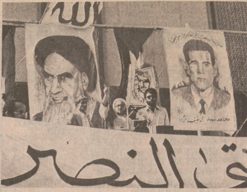
TEHERAN. — Szejk Sadegh Khalkhali, szef centralnego sądu rewolucyjnego ogłosił, iż ktokolwiek zabije szacha Mohammada Reza Pahlavi, członków jego rodziny bądź współpracowników, wykona wyrok wydany przez sąd.