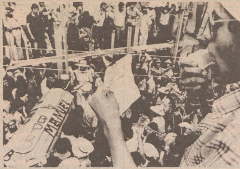
SAN SALWADOR. — Członek lewicowego ugrupowania rewolucyjnego przemawia na pogrzebie 17 towarzyszy.

W myśl jedności, nad którą pracował św. Andrzej, wszystkich Rodaków prosimy o zainteresowanie się o wspólny wysiłek w postaci ofiar na to piękne "votum" ku czci Patrona Ojczyzny, polskiego Jezuita, Bo-