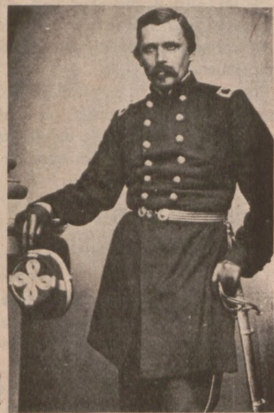
Colonel Wladimir Krzyzanowski, c. 1861.

Hardbound edition only $5.00 plus 50 cents for postage and handling.