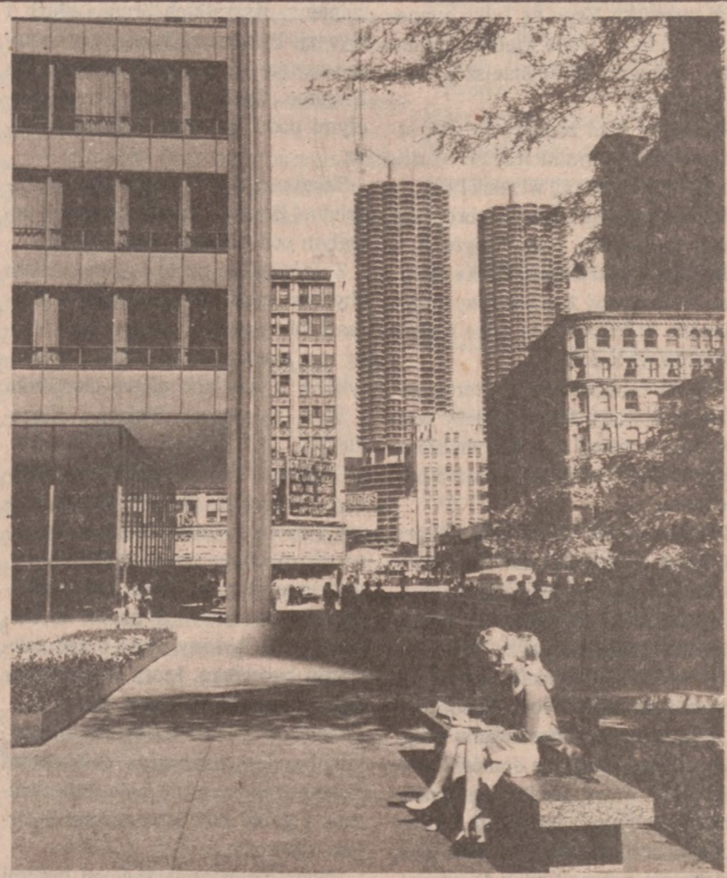
Chicago — W środku "Marina Towers"

Szlaban graniczny podnoszony jest co godzinę i przepuszczane są jedynie samochody oficjalnych przedstawicieli władz. Samochody z Izraela przejeżdżają granicę o każdej godzinie parzystej, samochody egipskie — o nieparzystej.