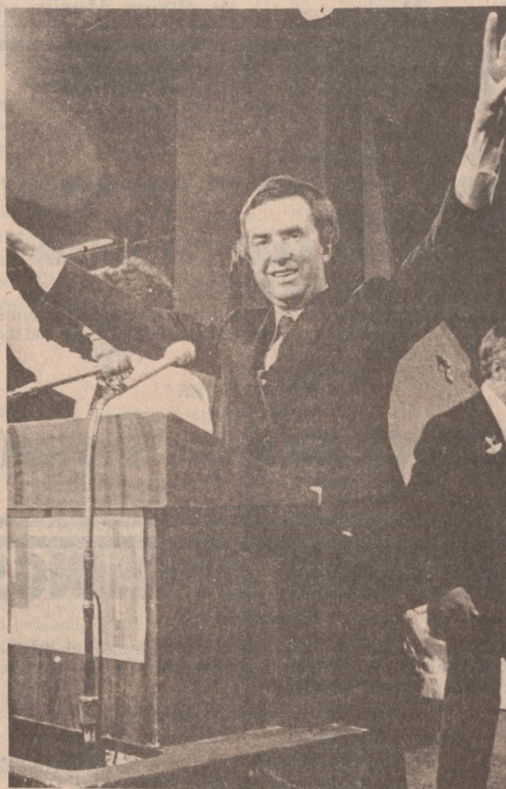
SPRUCE GROVE, ATLA. — Joe Clark z partii konserwatywnej zwyciężył w wyborach w Kanadzie, pokonując Pierre Trudeau, dotychczasowego premiera, kandydata z ramienia partii liberalnej.

Powiedział on, iż firma Krupp-Koppers posiada 23 umowy na przekształcenie węgla w paliwo płynne. Umowy te zawarto z 15 krajach z różnymi klientami.