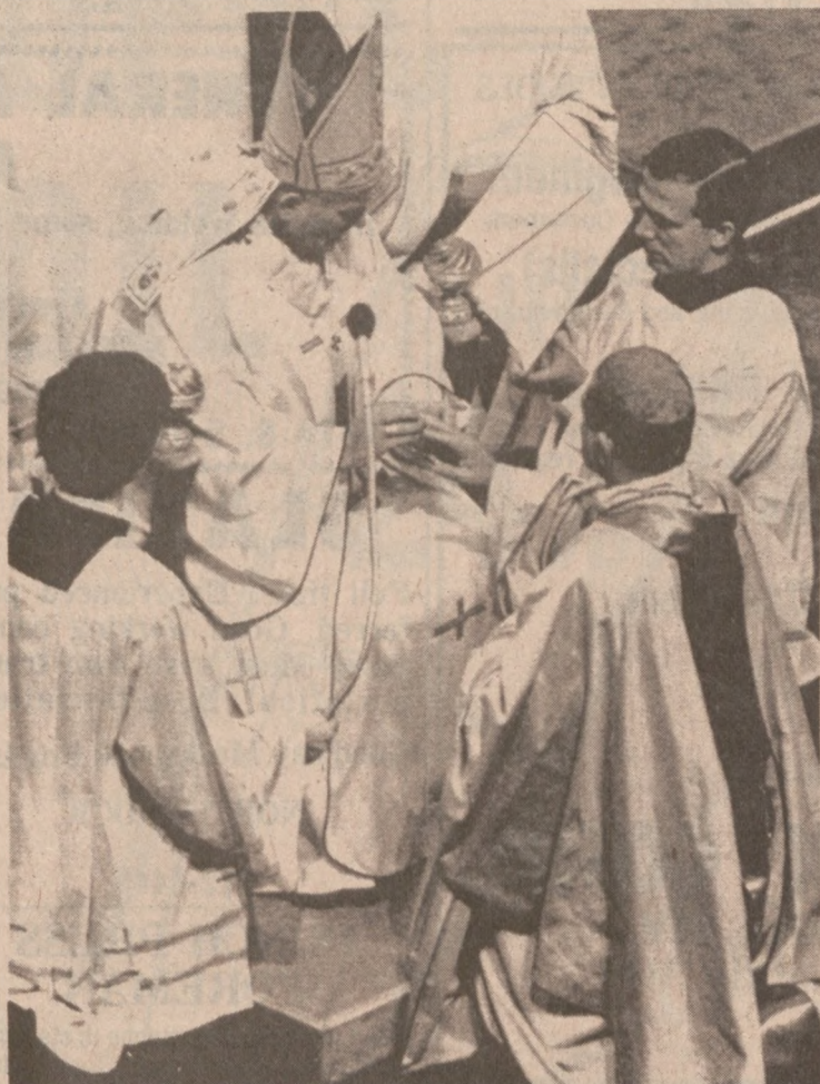
WATYKAN. — Arcybiskup miasta Meksyk otrzymuje pierścień kardynalski od Papieża Jana Pawła II w bazylice św. Piotra.

Dotychczas, władze stanowe płaciły przeciętnie $23 za dzień pobytu pacjenta w domu starców, obecnie suma ta prawdopodobnie wzrośnie co najmniej o $5.