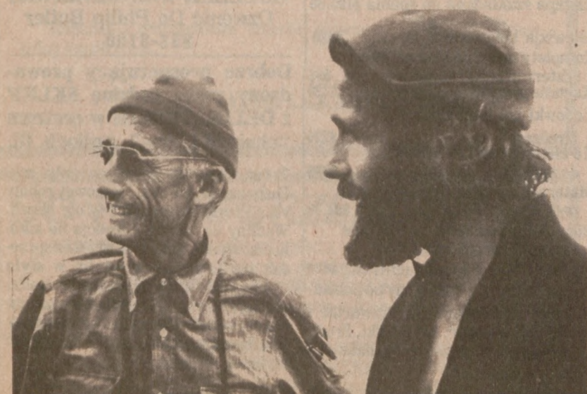
LIZBONA. — Syn znanego oceanografa Jaques Cousteau, Philippe zginął w katastrofie lotniczej w Portugalii.

Trzygodzinna kwesta na remont Muzeum Historii Amerykańskich Murzynów odbędzie się 29 lipca na trasie szlaku z ważnymi pamiątkami dla mniejszości murzyńskiej spod Pioneer Court, 1401 N. Michigan, gdzie mieszkał pionier chicagowskich murzyńskich osiedleńców, Du Sable w kierunku gmachu muzeum, miesz-