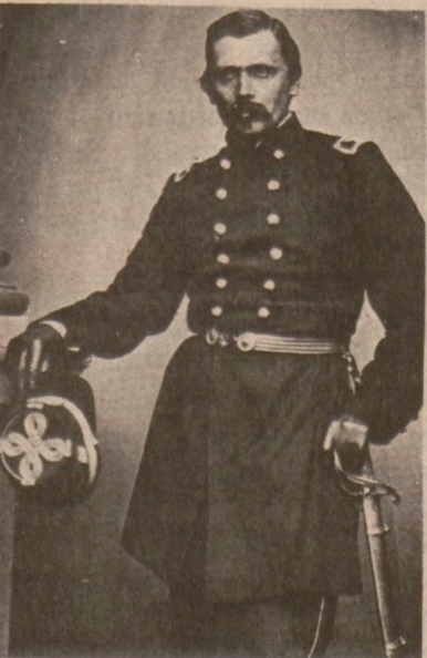
Colonel Wladimir Krzyżanowski, c. 1861.

Hardbound edition only $5.00 plus 50 cents for postage and handling.