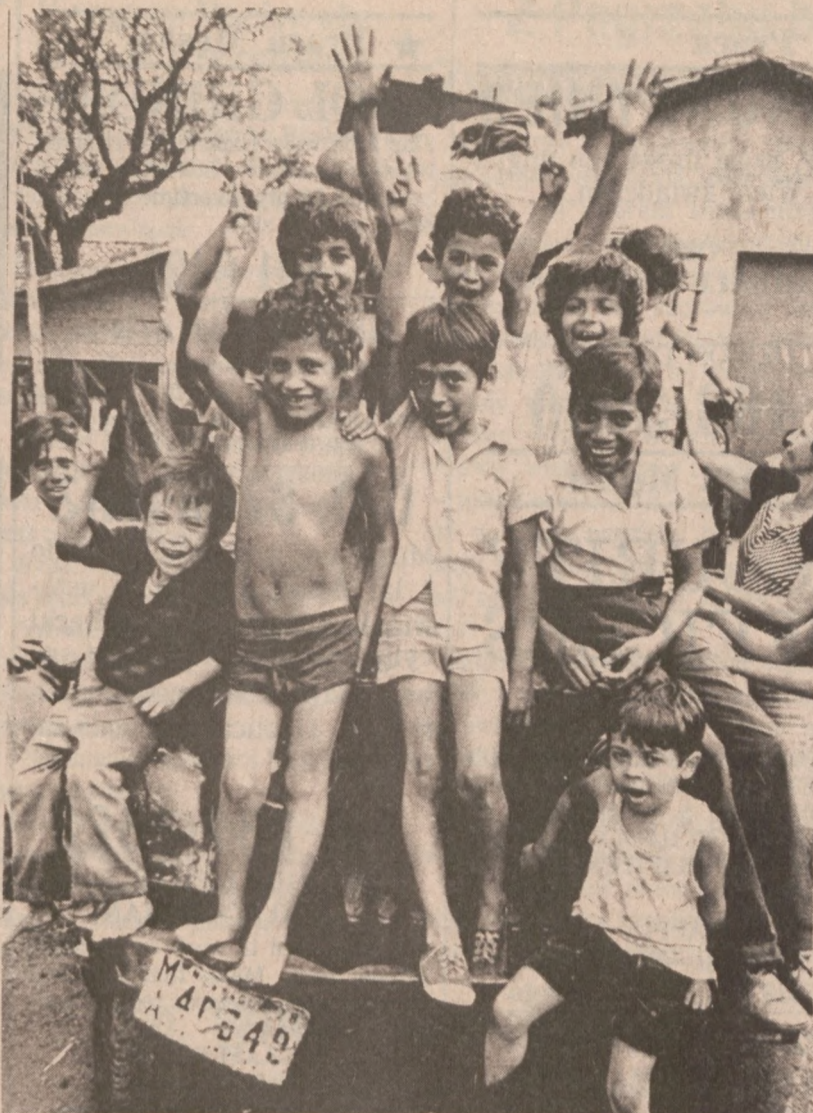
MANAGUA, NICARAGUA. — Nawet dzieci wydają się być zadowolone z powodu ucieczki Somozy do USA.

Prokurator uważa, że członkowie rodziny Hunta, w których rękę znajdowały się akcje, byli faktycznymi, chociaż zakamuflowanymi właścicielami kryjącymi się pod nazwą Colorado City Realty Co.