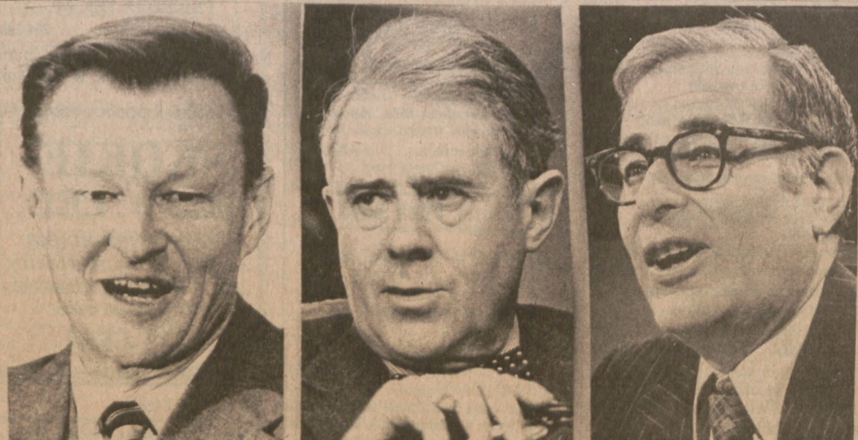
WASHINGTON — Vance, Brown i Brzezinski — "grupa bezpieczeństwa narodowego". Wszyscy oni pozostali w częściowo odnowionym rządzie prezydenta Cartera