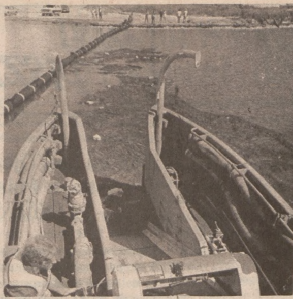
SOUTH PADRE ISLAND, TEXAS. — Przed dotarciem ropy naftowej do wybrzeży Taksasu pracownicy przygotowują specjalny sprzęt do usuwania płynącego osadu z powierzchni wody.