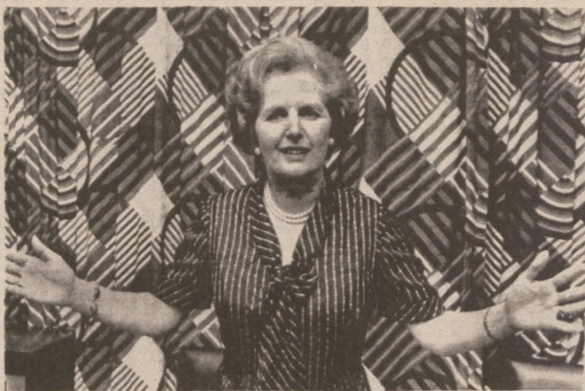
LUSAKA, ZAMBIA. — Premier Zjednoczonego Królestwa Margaret Thatcher w czasie konferencji Wspólnoty Narodów. Pod przewodnictwem pani Thatcher członkowie wspólnoty wypracowali kompromisową formułę zakończenia wojny domowej.