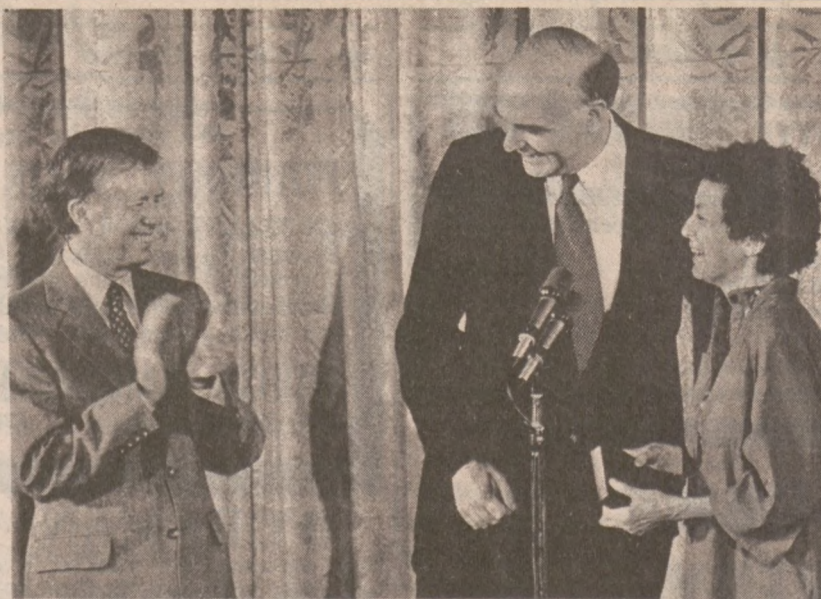
WASHINGTON — Po ceremonii zaprzysiężenia nowego przewodniczącego Federalnej Rady Rezerw Paula Volckera. Sekretarzowi towarzyszy żona.