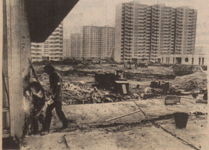
MOSKWA. — Spawacze pracują przy budowie Wioski Olimpijskiej, gdzie wszystko ma być gotowe na igrzyska w lecie 1980. (UPI)

Polacy wystąpią po raz czwarty w finale Pucharu Europy: w 1973 r. w Bonn zajęli I miejsce, w 1975 r. w Bydgoszczy — II, a w 1977 r. w Lille (Francja) — VI. Jeśli chodzi o kobiety to do finału zakwalifikowały się: Niemcy Zachodnie, Wielka Brytania, Niemcy Wschodnie, Holandia, ZSRR i Węgry. Polska w półfinale wycięła rozgrywkach w Budapeszcie zajęła dopiero czwarte miejsce za ZSRR, Węgrami i Bułgarią i odpadła.