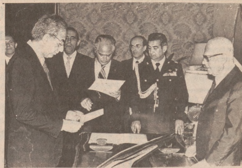
RZYM. — Zaprzysiężenie 42-go z kolei premiera Włoch Francesco Cossiga (z lewej) przez prezydenta Sandro Pertini.