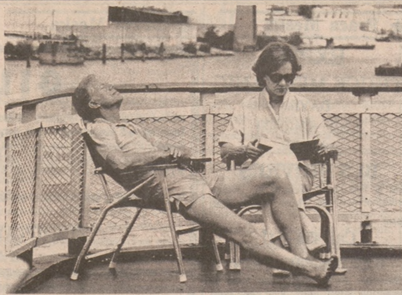
DUBUQUE, IOWA. — Prezydent Carter i małżonka Rosalynn wypoczywają na pokładzie parowca "Delta Queen".

Dwóch innych cywilnych pracowników centrum zostało usuniętych z ich stanowisk.