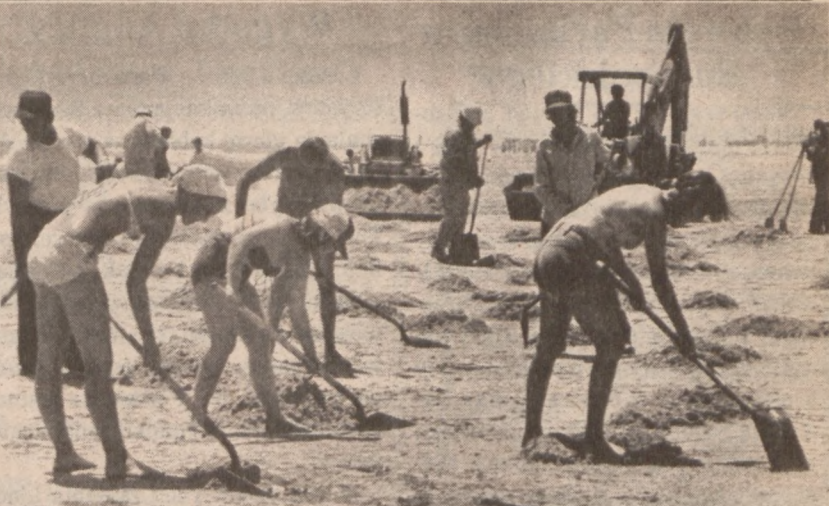
SOUTH PADRE ISLAND, TEXAS. — Turyści — ochotnicy pomagają w oczyszczeniu plaży zanieczyszczonej ropą naftową.

Klub Borek Wielki Nr 132 ZNP oraz Zespół Taneczny "Polonez" przy ZPRK urządzi wspólnie dożynki w poniedziałek, 3 września (Labor Day) w ogrodzie Woźniaka, 2530 Blue Island Ave. Początek o godz. 12 w poł. Do tańca przygrywać będzie orkiestra Kujawiak. W programie tańce i przysięgi ludowe w wykonaniu "Polonez."