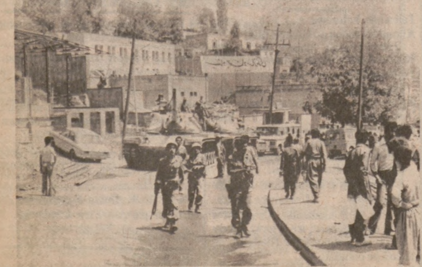
IRAN. — Żołnierze Ayatollah Khomeini'ego uzbrojeni po zęby w broń amerykańską na froncie kurdyjskim.