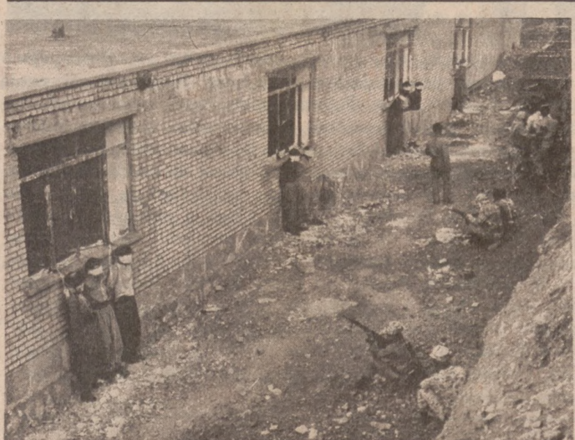
REWOLUCJONISCI ISLAMSCY w Iranie krwawo rozprawiają się z Kurdami, walczącymi o autonomię dla swego okręgu etnicznego. Na zdjęciu moment wykonywania egzekucji.

Ateny (UPI) — Były amerykański sekretarz stanu Dean Rusk, obecnie prawa międzynarodowego na Uniwersytecie w Georgia, stanął w obronie ambasadora Andrew Younga i powiedział, że miał on rację, odbywając tajne spotkanie z przedstawicielem PLO, i popełnił jedynie ten błąd, że o spotkaniu tym nie poinformował swoich przełożonych.