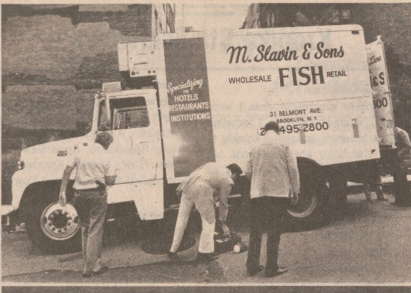
NOWY JORK. — Ciężarówka do przewożenia ryb której bandyci użyli przy kradzieży $2 milionów w Nowym Jorku 21 sierpnia.

Londyn (DP) — Szesiunas, reprezentant Sowietów w canoe, złoty medalista olimpijski w 1972 r., wybrał wolność w Niemczech Zach.