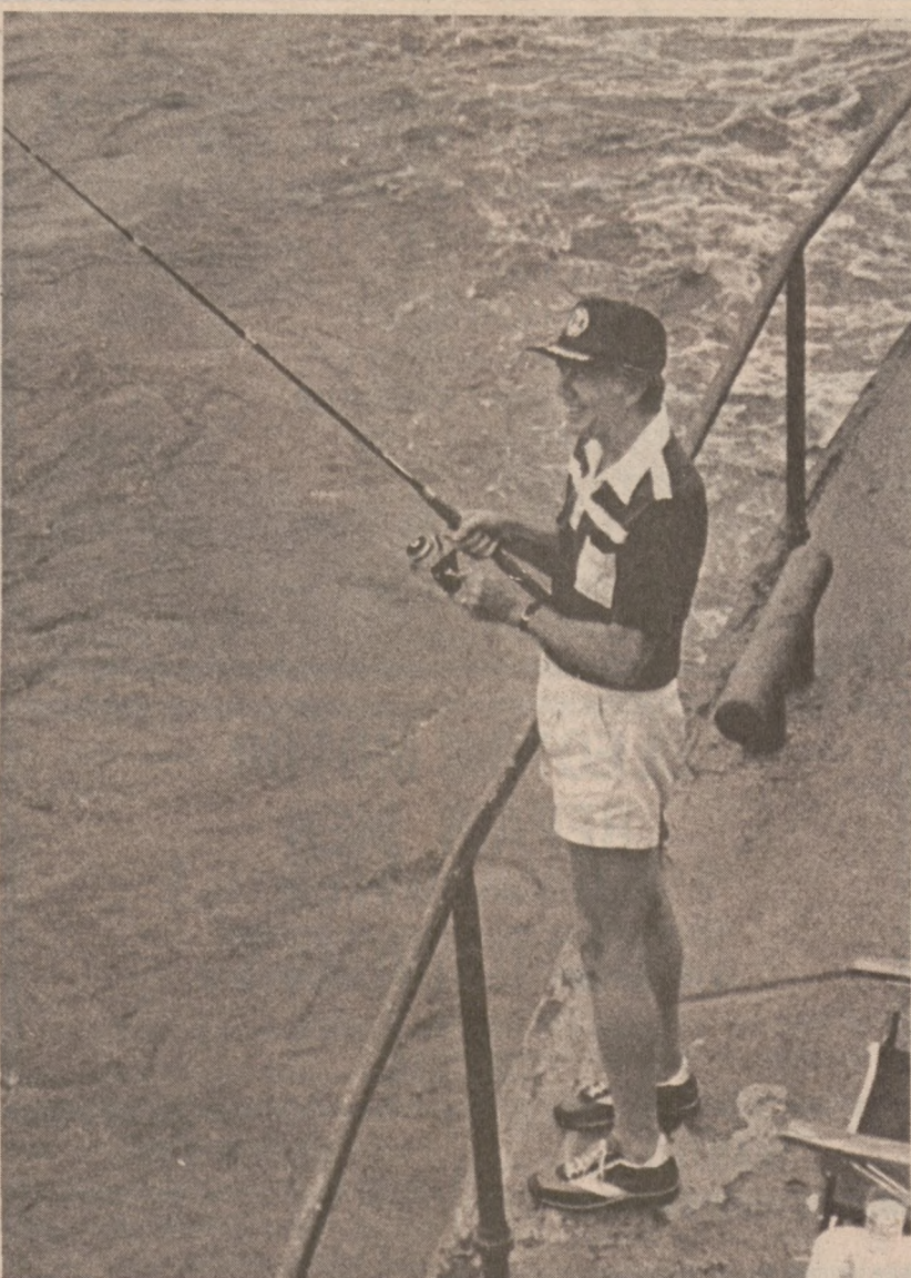
BUFFALO, IOWA. — Prezydent Carter łowi ryby w czasie wycieczki, która była połączeniem wakacji z kampanią wyborczą.

Katedra chicagowska może pomieścić 2,000 osób.