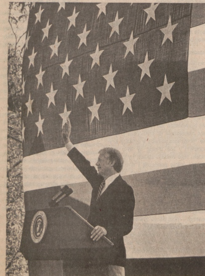
BURLINGTON, IOWA. — Prezydent Carter w czasie spotkania z mieszkańcami miasteczka Burlington.