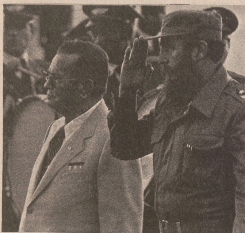
HAVANA. — 87-letni prezydent Jugosławii Tito witany przez Fidela Castro i kubańską kompanię honorową po przybyciu na konferencję krajów niezaangażowanych.

Decyzja w sprawie jego płacy nie została jeszcze podjęta.