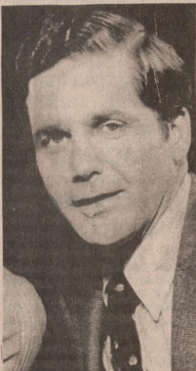
JEB STUART MAGRUDER, uwikłany kiedyś w aferę Watergate będzie służył jako seminarian w kościele prezbiteriańskim.