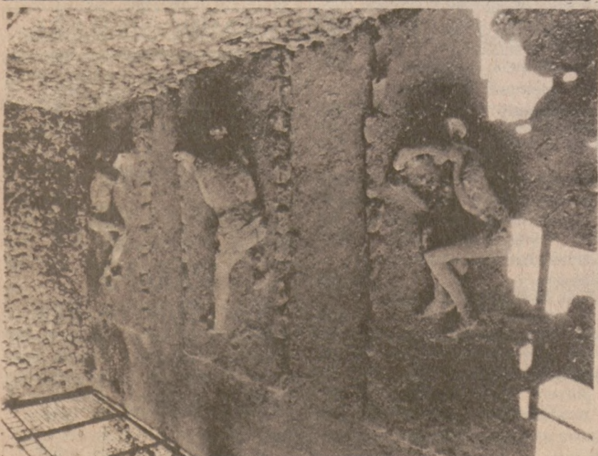
POMPEJA, WŁOCHY. — W 1900 rocznicę wybuchu Wezuwiusza, który pogrzebał Pompeję po raz pierwszy pokazano odlew gipsowe zrobione we wgłębieniach, które były pozostałością rzymskiej rodziny zabitej najwidoczniej przez popioły wulkaniczne w czasie snu.