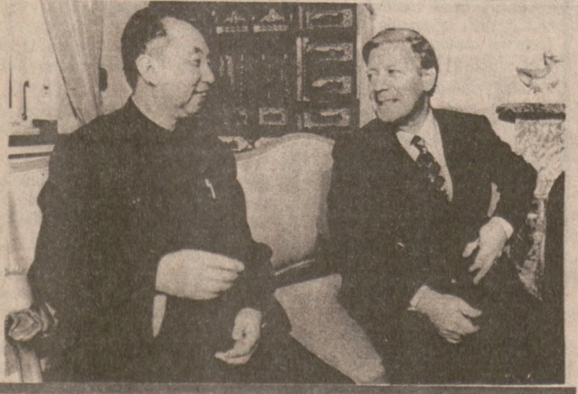
BONN, NRF. Kanclerz Niemiec Zach. Helmut Schmidt przyjął przebywającego z wizytą oficjalną w krajach Europy Zachodniej premiera ChRL Hua Guofeng'a.

Popierajcie tych, którzy ogłaszają się w Dzien. Związkowym