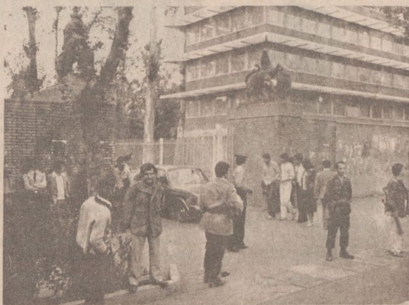
TEHERAN. — Policja i “rewolucjoniści” spokojnie stoją przed gmachem ambasady brytyjskiej która została opanowana przez rozwydrzonych studentów. Gmach ambasady brytyjskiej znajduje się w pobliżu ambasady amerykańskiej gdzie motłoch trzyma zakładników. (UPI)

Londyn (UPI) — Kurs dolara wzrósł na wszystkich giełdach europejskich, a na giełdzie tokijskiej podskoczył do poziomu nienotowanego od prawie dwóch lat. Rzeczoznawcy twierdzą, że przyczyniła się do tego akcja Stanów Zjednoczonych, zmierzająca do uratowania zakładników w Teheranie.