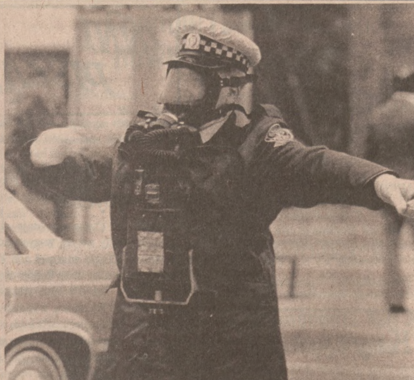
MISSISSAUGA — Ontario: Policjant w masce przeciwgazowej kierujący samochody na drogę objazdową z zagrożonego terenu, gdzie wskutek wycieknięcia pociągu ze zbiorników przewożących substancję chemiczną wydzielał się szkodliwy dla organizmu gaz.

i Wood. Członkowie proszeni są o liczne przybycie, ponieważ są ważne sprawy do omówienia.