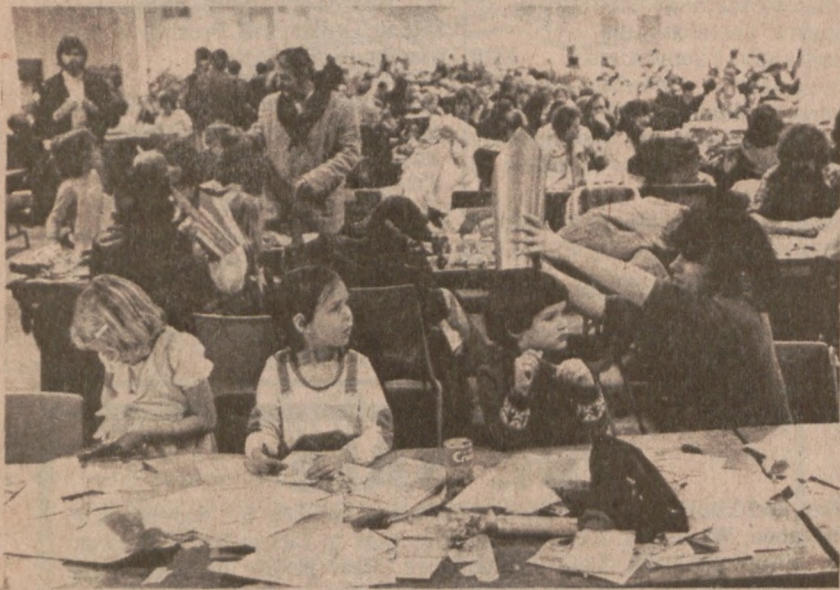
MISSISSAUGA — Ontario: 1,500 osób z 200 tys. ewakuowanych mieszkańców Mississaugi, miasta zagrożonego oparami trującego gazu wydzielającymi się z wykolejonych wagonów-cystern, znalazło schronienie w salach wystawowych pobliskiego lotniska. (UPI)

Illinois otrzymało zapomogę na sumę $2.9 miliona z funduszy federalnych (Law Enforcement Assistance Administration) na rozszerzenie programów mających na celu walkę z przestępczością.