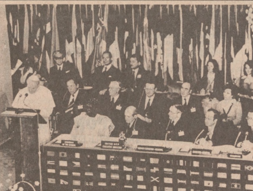
RZYM — Papież Jan Paweł II przemawia na 20-ej sesji FAO — agencji ONZ do spraw Żywności i Rolnictwa.