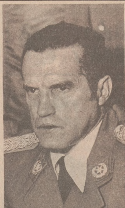
LA PAZ, BOLIWIA — Pułkownik Alberto Natusch Busch dokonał zamachu stanu w Boliwii i objął rząd.

W akademiach wezmą udział politycy, znani aktorzy i popularni reprezentanci życia społecznego.