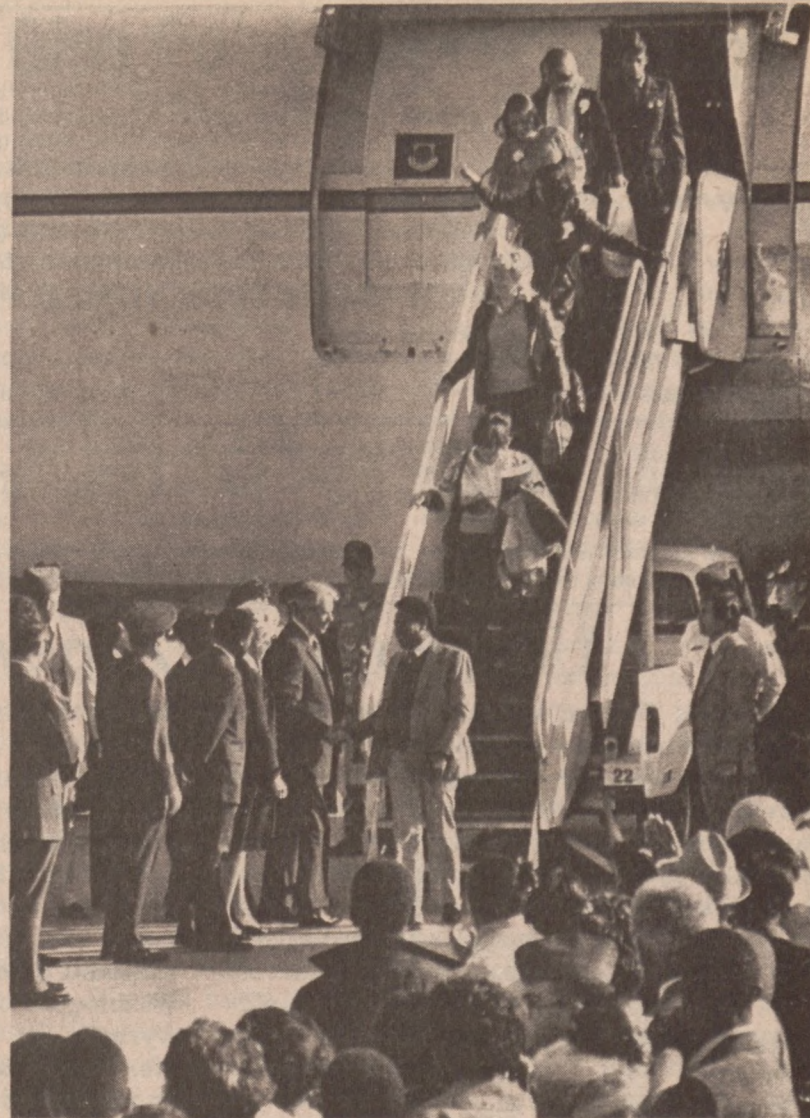
SEKRETARZ STANU Cyrus Vance wita grupę zakładników zwolnionych przez studentów irańskich, którzy zajęli ambasadę amerykańską w Teheranie.

2886 MILWAUKEE AVE., CHICAGO, ILL. 60618 PH. 489-2554. POLECAMY wielki wybór książek polskich i o Polsce po angielsku. Na składzie wiele książek o Papieżu, albumów na podarki, bogaty wybór literatury, powieści sensacyjnych, książki dla dzieci i młodzieży, publikacje historyczne, społeczne, słowniki, książki do nauki angielskiego, encyklopedie. Duży wybór polskich płyt, koled, polskich kart świątecznych itd. Księgarnia czynna w poniedziałki i czwartki od 10 do 7 p.m., w inne dni tygodnia od 10 r. do 6 p.m.