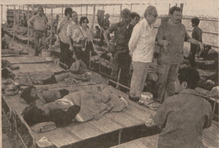
KAI I DANG, TAJLANDIA. — Przedstawiciel ONZ Javier Perez de Cuellar wizytuje szpital polowy zorganizowany dla uchodźców z Kambodży.

Władze oficjalnie odmówiły jednak stanowczej interwencji i dochodzenie przeciwko kompanii zarządzającej ośrodkiem wszczęła agencja BGA.