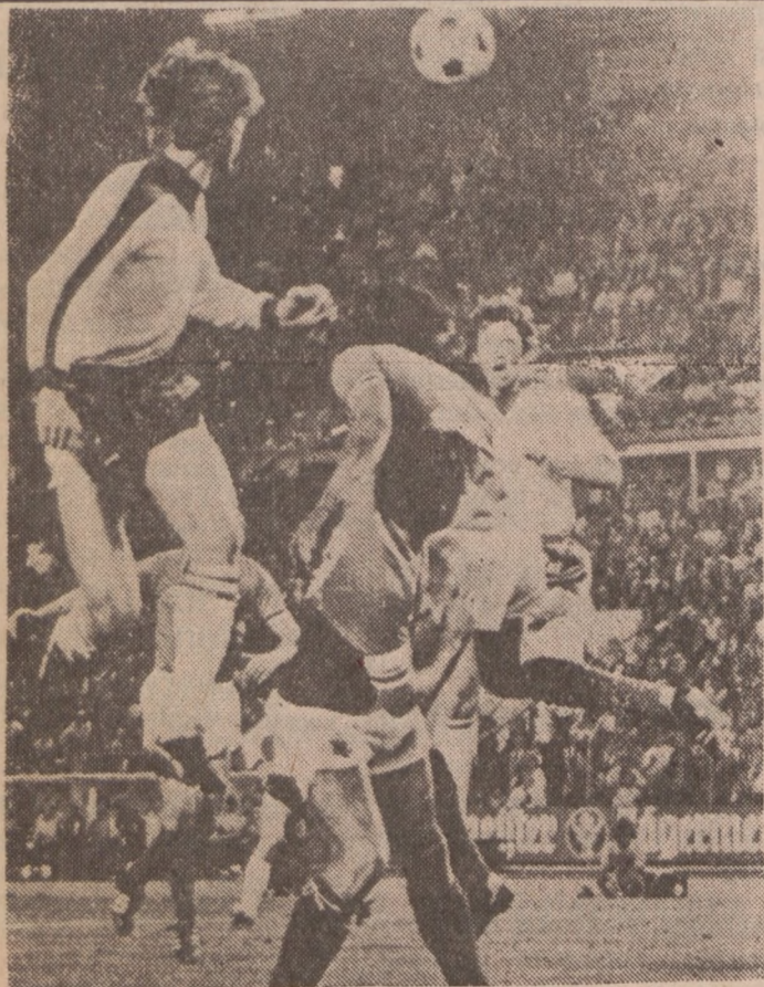
Piłkarze Glasgow Rangers w II rundzie Pucharu Zdobywców Pucharów zmierzają się z hiszpańską drużyną Valencia. Na zdjęciu: zacięta walka o piłkę pod bramką Szkotów podczas ich rewanżowego meczu I rundy z Fortuną w Duesseldorfie (0:0)

Do finału zakwalifikowały się: Anglia, Włochy — automatycznie jako gospodarz, Holandia i Grecja, która zajęła I miejsce w grupie VI.