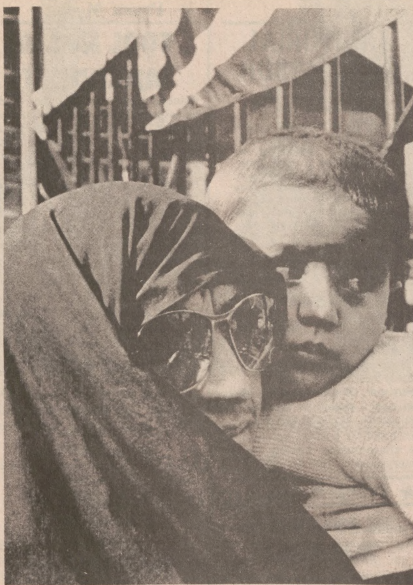
TEHERAN. — Irańska kobieta z dzieckiem na ręku przed bramą ambasady amerykańskiej w Teheranie, gdzie nadal demonstrują fanatycy religijni żądając wydania szacha.