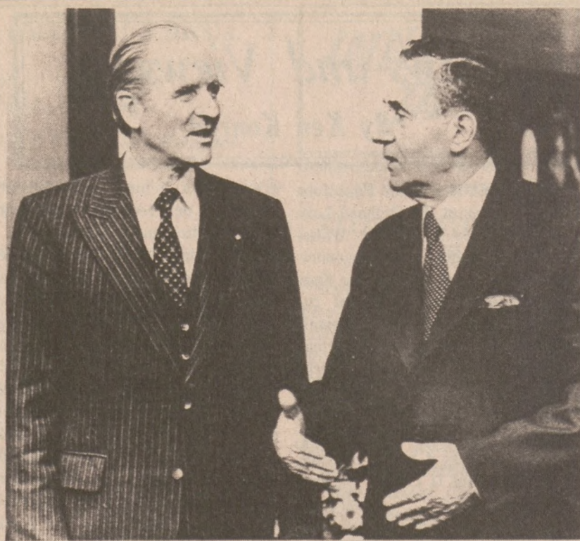
BONN. — Sowiecki minister spraw zagranicznych Andrzej Gromyko spotkał się z prezydentem NRF Karlem Carstensem w czasie czterodniowej wizyty w Niemczech Zachodnich.

Kazimiera Pytel, komisarka Okr. 13 Eleonora Tragarz, sekr.