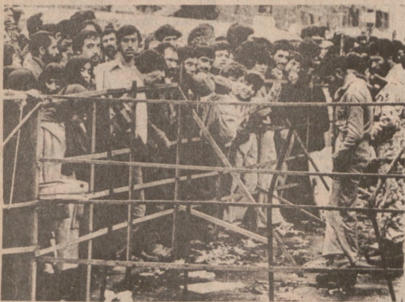
TEHERAN. — Studenci okupujący gmach ambasady amerykańskiej w Teheranie ustawili ogrodzenie wstrzymujące tłumy żądające wydania przetrzymywanych w ambasadzie zakładników.

Małżeństwo Miller oświadczyło pracownikom opieki społecznej, że nie posiada żadnych dochodów i potrzebuje pomocy finansowej.