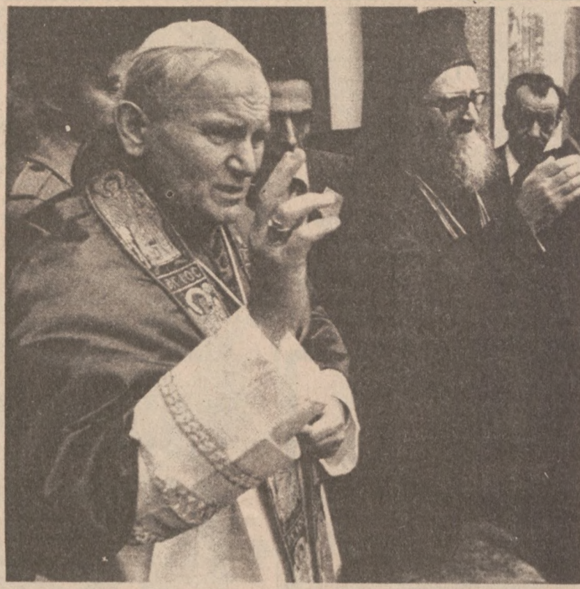
ISTANBUL. — Papież Jan Paweł II i Patriarcha Dimitros I udzielają błogosławieństwa w czasie ostatniego dnia pobytu Ojca św. w Turcji.