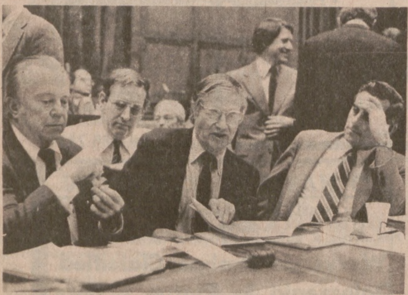
WASHINGTON. — Izba Reprezentantów zaaprobowala $3.5 biliona na pomoc dla Chrysler Corp. Specjalna komisja pracuje nad ostatecznym brzmieniem uchwały. (UPI)

● KUPUJCE W SKŁADACH ● KTÓRE OGŁASZAJĄ SIĘ W DZIENNIKU ZWIĄZKOWYM