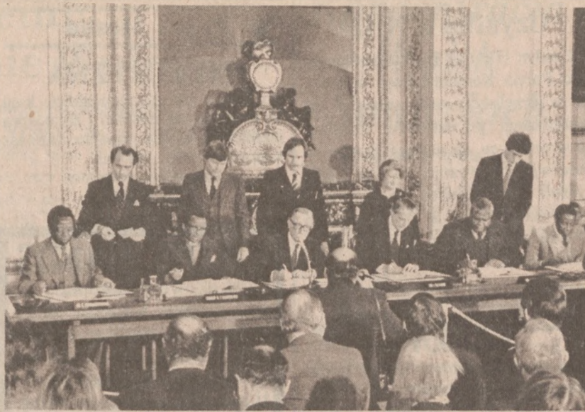
LONDYN. — W Londynie podpisano historyczne porozumienie w sprawie przyszłości Rodezji-Zimbabwe. (UPI)

Beck stwierdził, iż powiat otrzymał w spadku po komisji około $90 mln. w postaci długów. W chwili obecnej prowadzone są badania, celem ustalenia właściwej pozycji finansowej podległych uprzednio komisji instytucji.