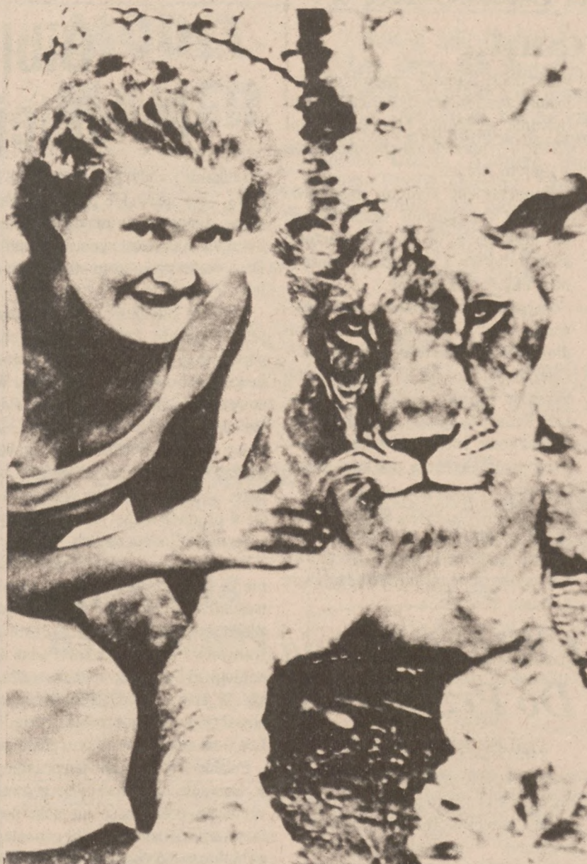
NAIROBI, KENIA. — Joy Adamson, zoolog, autorka słynnej trylogii o lwicy Elzie, znaleziona została w obozie w buszu martwa. Policja prowadzi dochodzenia w sprawie jej zabójstwa.