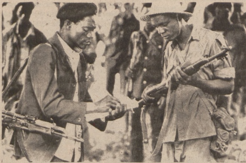
RODEZJA. — Partyzanci rodezyjscy podają numery seryjne swoich karabinów, które są rejestrowane przez oficera z ugrupowania Frontu Patriotycznego. Akcja ta jest przeprowadzana w ramach przygotowania kraju do przejęcia całkowitej władzy przez rząd murzyńskiej większości.

Emil J. Jarosz MIRROS MEDICINE CO. INC. 3446 W. 38th Place Chicago, IL 60632 • Tel. 254-8386