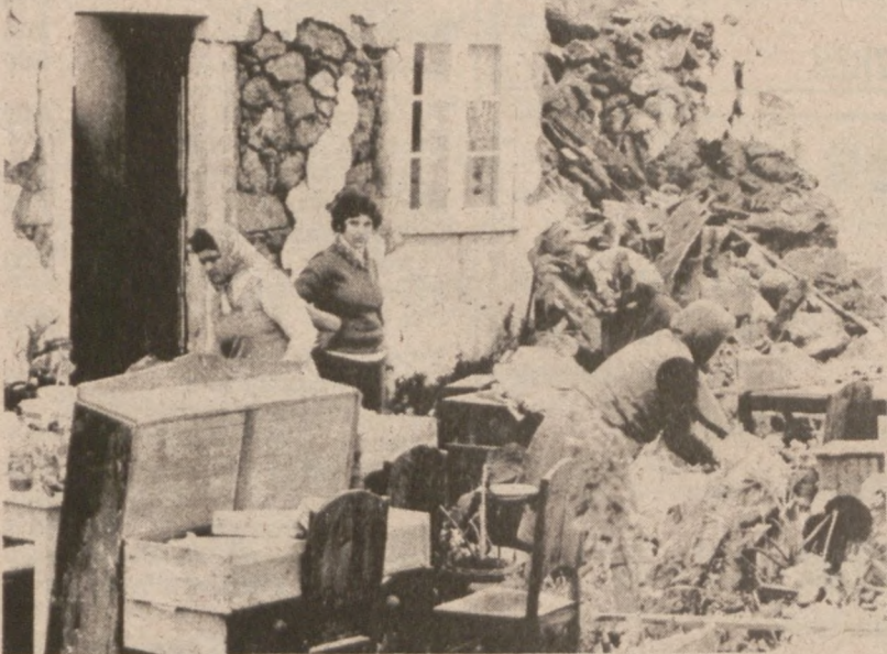
AZORY — Mieszkańcy Terceiry wynoszą dobytek ze zniszczonych domostw wskutek trzęsienia ziemi. 50 osób straciło życie.

Sen. Percy rozmawiał z dziennikarzami w Springfield przed spotkaniem w Klubie Lions, gdzie miał wygłosić odczyt, jako członek Senackiego Komitetu Spraw Międzynarodowych. Sen. Percy zwrócił uwagę, że zajęcie przez Sowietów Afganistanu zagrożą rejonowi Środkowego Wschodu mającemu niezwykle znaczenie dla ekonomii Wolnego Świata ze względu na zasoby ropy naftowej i ważność szlaków morskich w zatoce Arabskiej i na Oceanie Indyjskim. Mówiąc o embargo nałożonym przez prez. Cartera na wywóz zboża do Sowietów, sen. poparł stanowisko prezydenta i zwrócił się do farmerów ze słowami "nie karmcie tych, których ręce was biją".