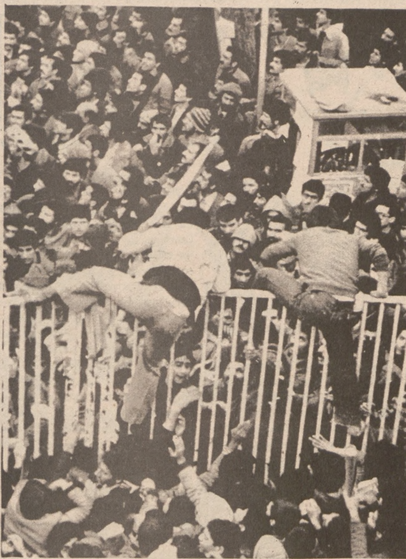
TEHERAN. — W Teheranie przed gmachem Politechniki starły się ze sobą dwie grupy demonstrantów. Część studentów zaatakowała ugrupowanie prokomunistyczne wznosząc okrzyki: "Iran nigdy nie będzie drugim Afganistanem." (UPI)