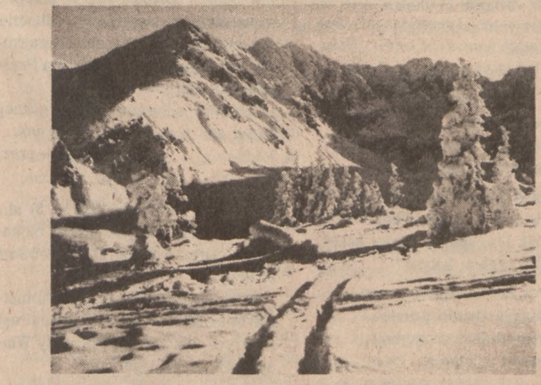
Hala Gąsienicowa pod Śniegiem

London (UPI) — Na wczorajsze ostrzeżenie prezydenta Cartera, że Stany Zjednoczone mogą użyć siły zbrojnej dla odparcia ewentualnego ataku sowieckiego na zagłębia naftowe w rejonie zatoki Perskiej, giełdy światowe zareagowały zwykłą ceną złota, dochodzącą do $50 na uncję.