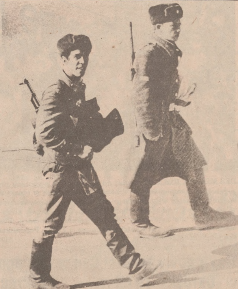
KANDAHAR, AFGANISTAN. — Dwóch sowieckich żołnierzy z patrolu pilnującego lotniska w Kandahar w Afganistanie.

MINIMAX CORPORATION 5905 North Clark St. Chicago, Ill.