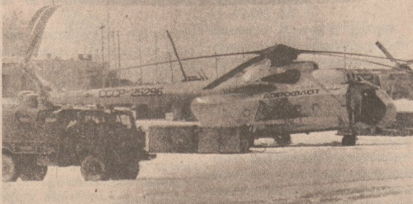
KABUL. — Do Kabulu ciągle napływają nowe posiłki w sprzeczce i ludziach przewożone helikopterami transportowymi z Sowietów.

Wydalenie przedstawicieli Kabulu i przyjęcie reprezentacji Islamskiego Przymierza będzie dla Sowietów porażką dyplomatyczną o poważnym znaczeniu.