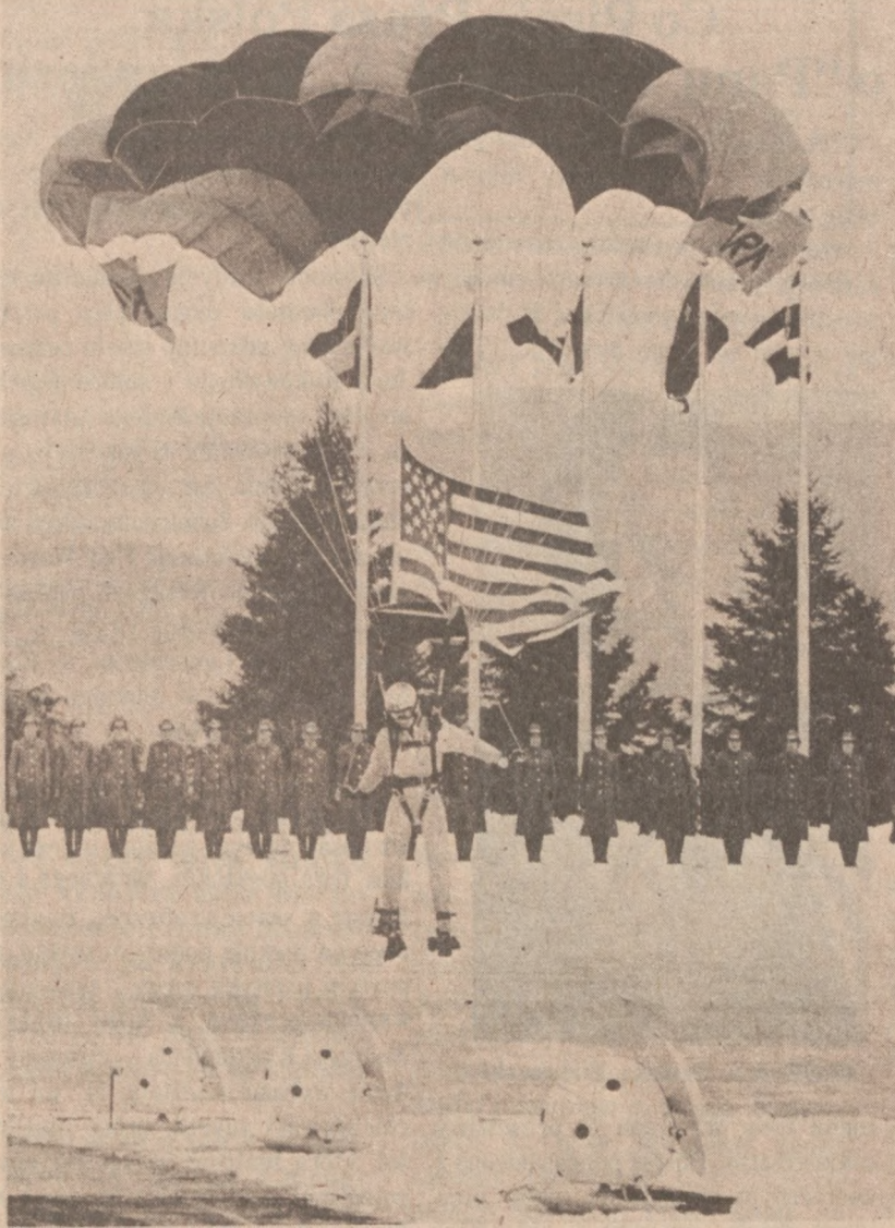
LAKE PLACID. — W czasie otwarcia XIII Zimowych Igrzysk Olimpijskich w Lake Placid, N.Y. odbył się pokaz spadochroniarzy.

Ostatnie badania dowiodły, że obraz został namalowany w XVIII wieku.