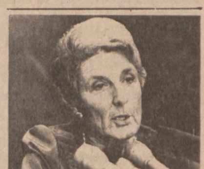
CATHERINE ROHTER, przewodnicząca Chicagowskiej Rady Szkolnej, zarządziła zamknięcie szkół publicznych na czas trwania strajku nauczycieli.

Klub Zmigrod przypomina swoim członkom i członkiniom, że miesięczne posiedzenie odbędzie się w niedzielę, 2 marca, w sali 1902 S. Leavitt ul., o godz. 2 po poł.