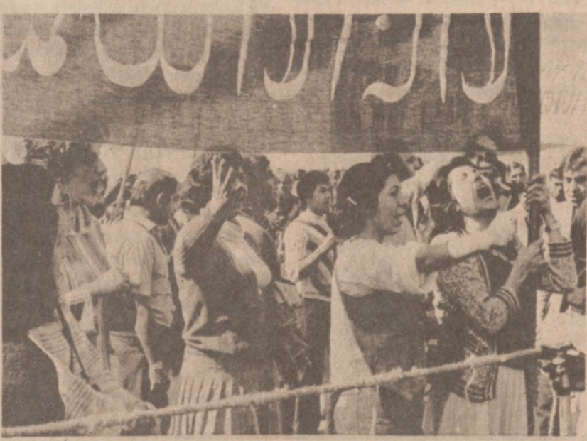
NEW DELHI. — Studenci afgańscy w stolicy Indii zorganizowali marsz protestacyjny w czasie wizyty A. Gromyki w Nowym Delhi przeciwko agresji sowieckiej na ich kraj.

Seul (UPI) — Władze południowokoreańskie zlikwidowały szajkę, zajmującą się operacjami czarno-rynkowymi, sięgającymi 17,2 milionów dolarów. Aresztowano 53 obywateli Korei Płd., 34 innych poszukuje policja. Do szajki należało 28 żołnierzy amerykańskich, mających dostęp do sklepów wojskowych Post Exchange.