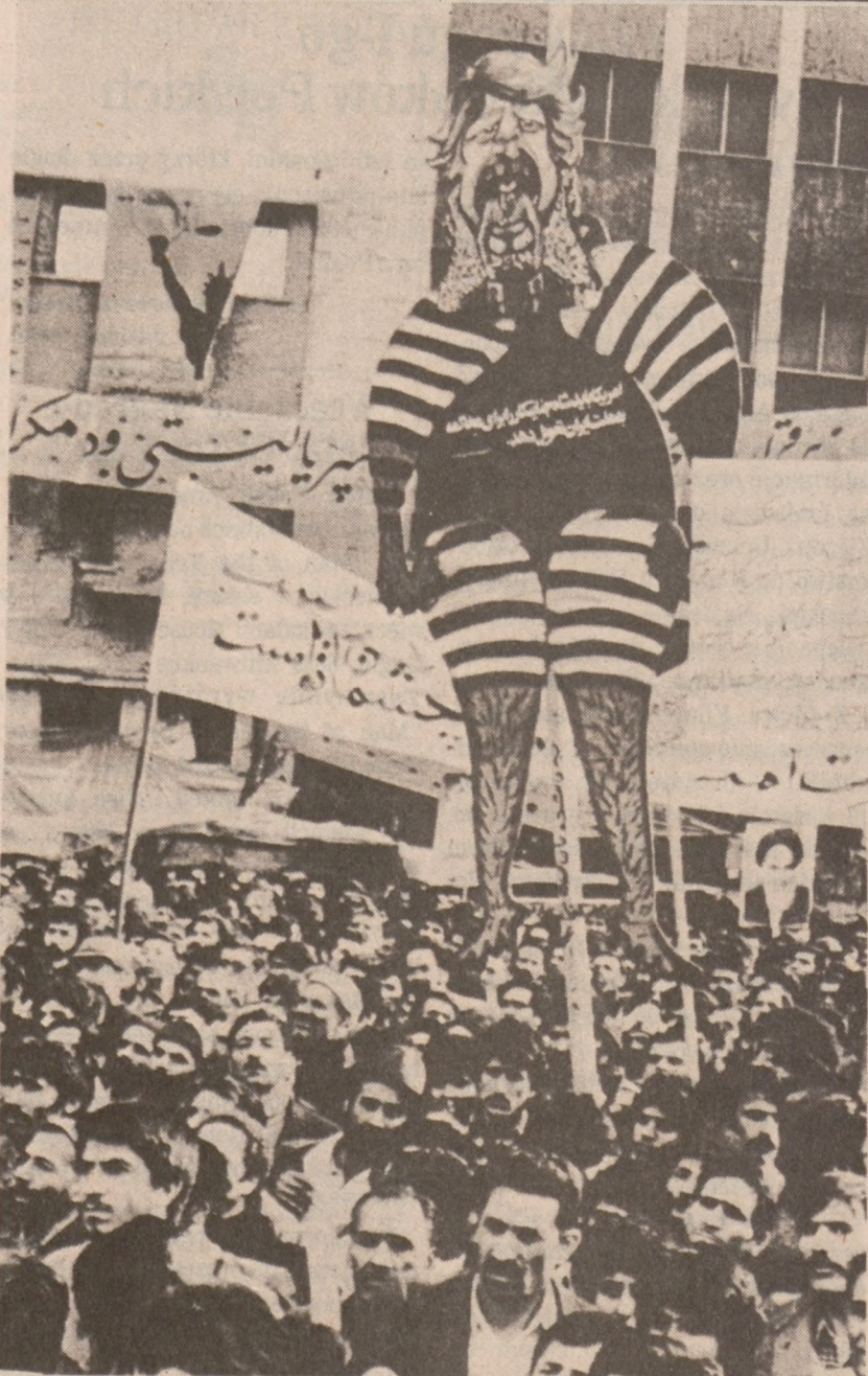
TEHERAN, Iran. — Demonstranci zgromadzeni przed ambasadą amerykańską nie ustają w żądaniach ekstradycji byłego szacha Iranu, jedynej (wg "studentów") drogi do wolności dla przetrzymywanych już ponad 100 dni amerykańskich zakładników.

Pogrzebem zajmuje się: Zakład Pogrzebowy B. F. Malec i Synowie. Telefon: 774-4100.