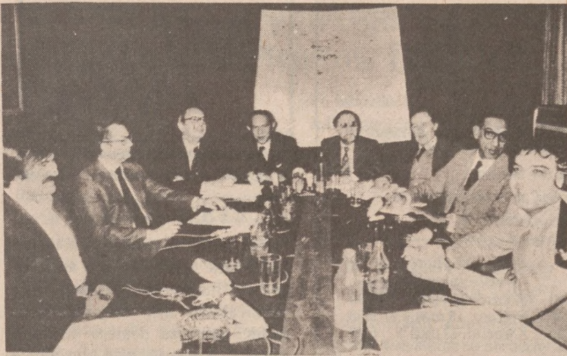
TEHERAN. — W stolicy Iranu specjalna komisja ONZ przystąpiła do przesłuchań świadków-ofiar oskarżających reżym byłego szacha o tortury i zbrodnie przeciwko ludności. (UPI)

Dorocznym zwyczajem nasze Towarzystwo urządza zabawę stołeczkową, tym razem odbędzie się w sobotę, 29 marca, w Paradise Hall, przy ulicach Wood i 48-ej. Początek o 7 wiecz. Będzie wiele fantów do wygrania oraz nagrody wejściowe, kawa i ciasto darmo. Zarząd uprasza członkostwo wraz z rodzinami i przyjaciółmi o wzięcie udziału w zabawie. Zapraszamy też bratnie organizacje i Grupy przynależne do Gminy 39-ej. — F. Goryl, prez.; K. W. Tokarz, koresp.