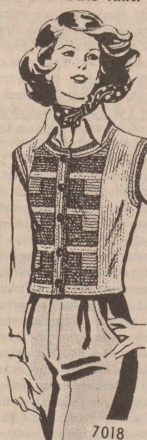
7018 by Alice Brooks

Newest fashion! Color blocks create a striking geometric look. EASY-TO-KNIT in simple garter stitch! Use synthetic worsted for this up-to-the-minute vest with a dramatic design in front, plain back. Pattern 7018: directions for sizes 8-10; 12-14 included. $1.75 for each pattern. Add 50¢ each pattern for first-class airmail and handling. Send for: Alice Brooks Needlecraft Dept. 263