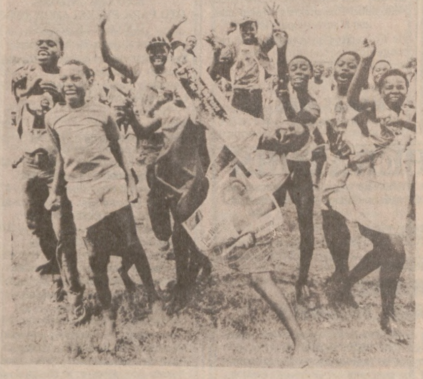
SALISBURY, Rodezja. — Grupa młodych stronników biskupa Abel Muzorewy demonstruje radość w spotkaniu ze swoim kandydatem, w czasie odbywających się wyborów.

Helikopter postradał "ogon" i część śmigła — pilot wyszedł z opresji bez szwanku.