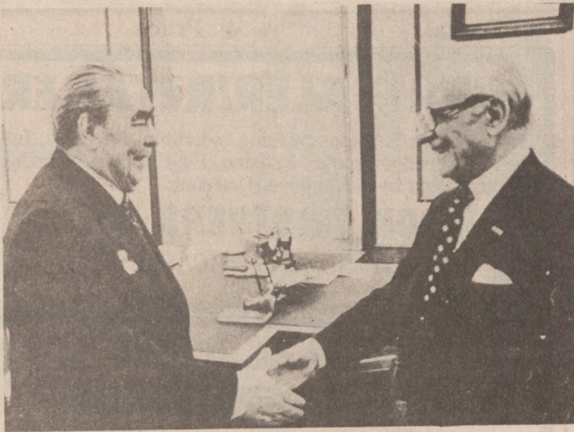
MOSKWA — Breżniew wita na Kremlu Armand Hammer, przemysłowca amerykańskiego, głowę Occidental Petroleum Corporation, któremu powiedział, że sankcje gospodarcze U.S. przeciwko Sowietom odbiją się ujemnie tylko na interesach firm amerykańskich.