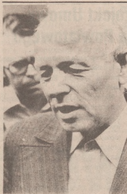
WASZYNGTON. — Andrej Sacharow, bojownik o prawa człowieka w Rosji zesłany do Gorki, powiedział, że gotów jest wyemigrować ze Związku Sowieckiego jeżeli władze udziela mu wizy wyjazdowej.

Pamiętaj, że wobec zmuszenia narodu polskiego do milczenia, "Dz. Związkowy" jest jego wolnym głosem.