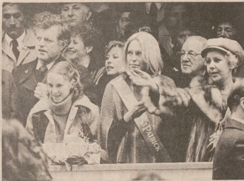
CHICAGO. — Sen. Edward M. Kennedy z małżonką Joan (w środku) wzięli udział w paradzie w dniu św. Patryka, w przeddzień prawyborów w stanie Illinois. Kennedy w prawyborach w naszym stanie przegrał do prez. Cartera stosunkiem 1 do 2.

Nie tylko na ich korzyść przemawia argument, że rodzina z przedmieść zużywa mniej wody niż rodzina w mieście, ale twierdzą, że jakość świadczonych usług w Chicago jest lepsza i droższa niż na przedmieściach.