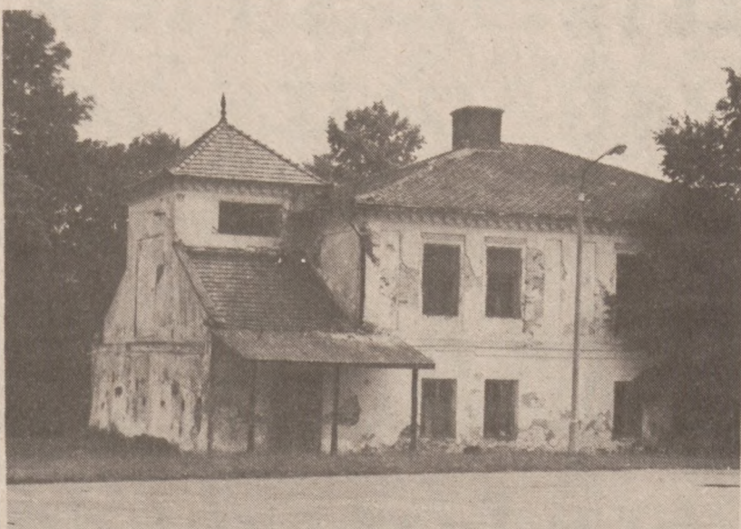
Dworek Jędrzejewiczów w Hyżnem

Fundacji im. gen. Władysława Sikorskiego, która wybudowała szkołę im. gen. Sikorskiego w Hyżnem koło Rzeszowa, gdzie tragicznie zmarły Premier R.P. spędził dzieciństwo, obecnie podejmuje pracę nad odnowieniem dworku (na zdjęciu), który był rezydencją Jędrzejewiczów, protektorów i opiekunów gen. w Sikorskiego. Jędrzejewiczowie opłacali kursa gimnazjalne i mieszkanie w domu młodego Sikorskiego.