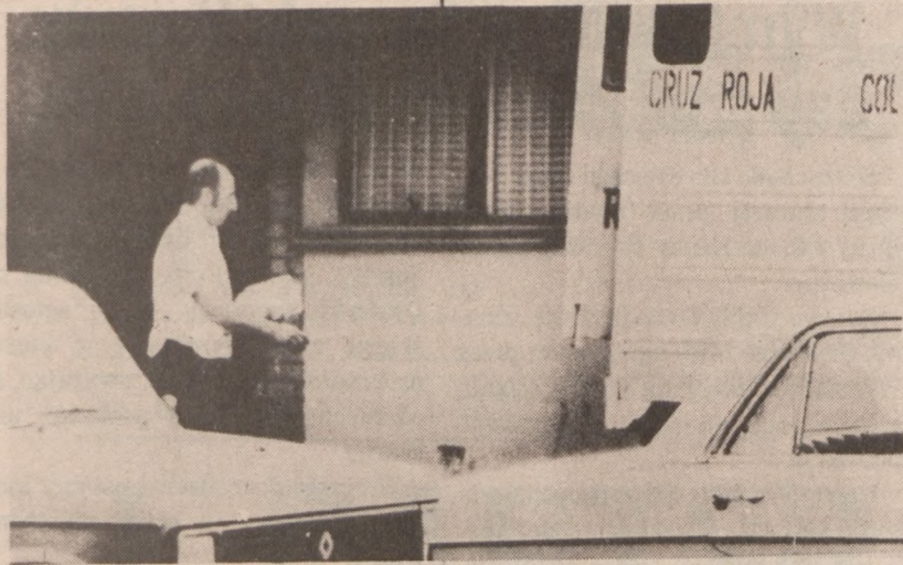
BOGOTA — Pracownik Czerwonego Krzyża po dostarczeniu posiłku zakładnikom przetrzymywanym przez terrorystów w gmachu ambasady dominikańskiej w stolicy Kolumbii wynosi listy od zakładników.