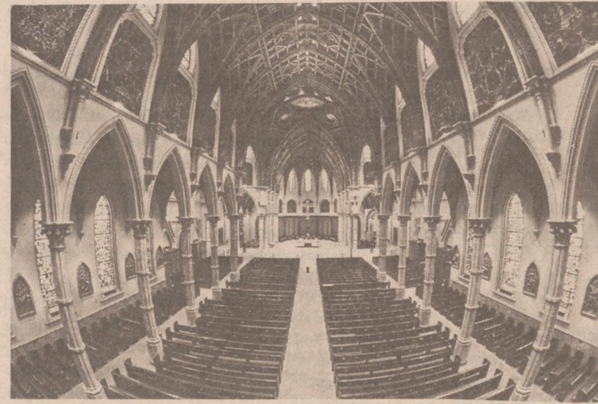
Wnętrze katedry Najśw. Imienia Jezus

Zdjęcie przedstawia piękne wnętrza chicagowskiej Katedry Najśw. Imienia, w której w tym Wielkim Tygodniu odbywają się główne nabożeństwa i obrzędy religijne, związane ze zbliżającym się Świętem Zmartwychwstania Pańskiego.