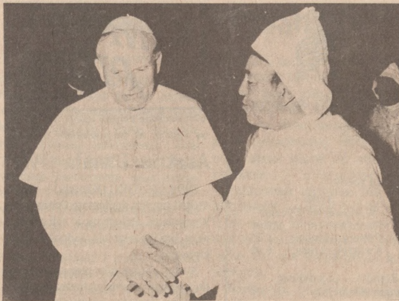
MIASTO WATYKAŃSKIE. — Papież Jan Paweł II przyjął na audiencji króla Maroka Hassana II z którym rozmawiał na temat statusu Jerozolimy. Król Hassan II jest przewodniczącym Komitetu Jerozolimskiego Konferencji Mahometan.

Ustalono w tych badaniach wyniki sytuacji w przemysłach produkcyjnych wskazują, że istnieje rozbieżność między nadziejami teoretyków życia gospodarczego a rzeczywistą sytuacją, jaka narasta w ekonomii kraju. (jb)