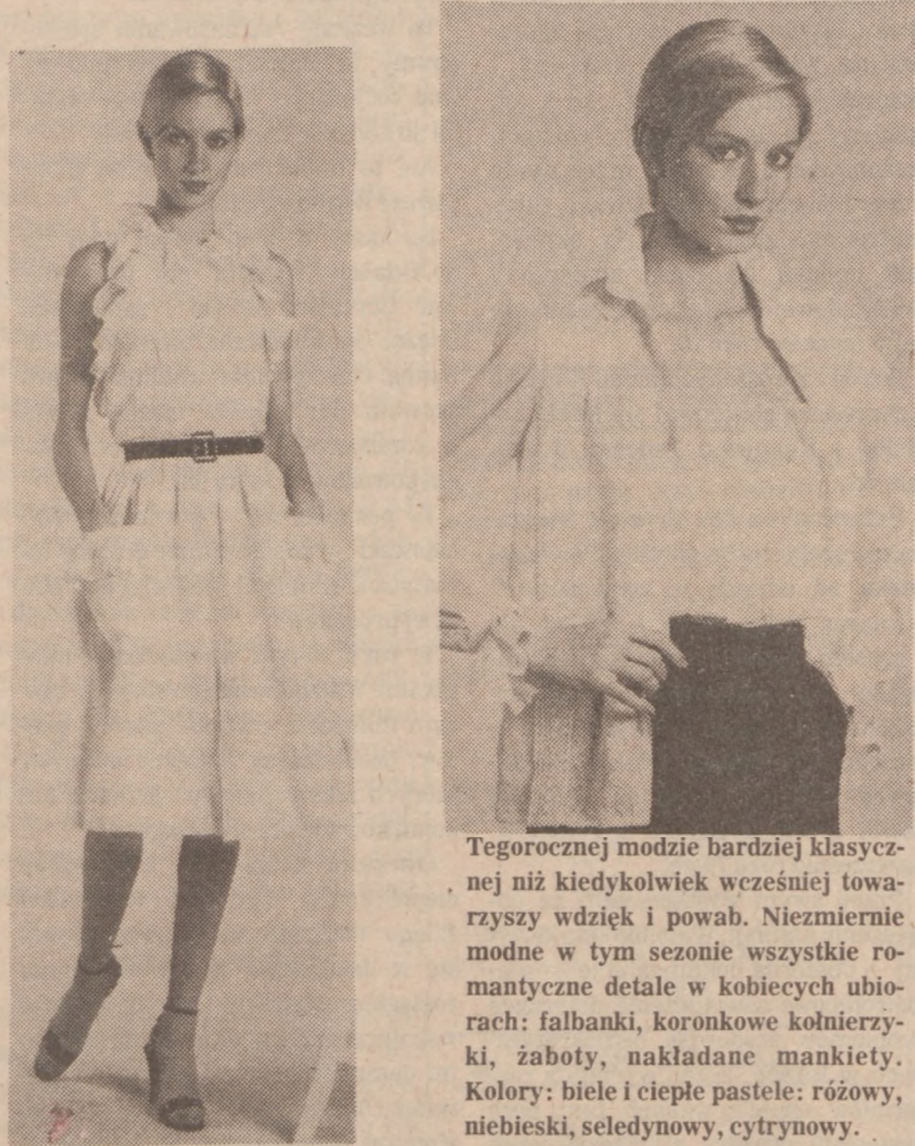
Tegorocznej modzie bardziej klasycznej niż kiedykolwiek wcześniej towarzyszy wdzięk i powab. Niezmiernie modne w tym sezonie wszystkie romantyczne detale w kobiecych ubiorach: falbanki, koronkowe kołnierzyki, żaboty, nakładane mankiety. Kolory: biele i ciepłe pastele: różowy, niebieski, seledynowy, cytrynowy.