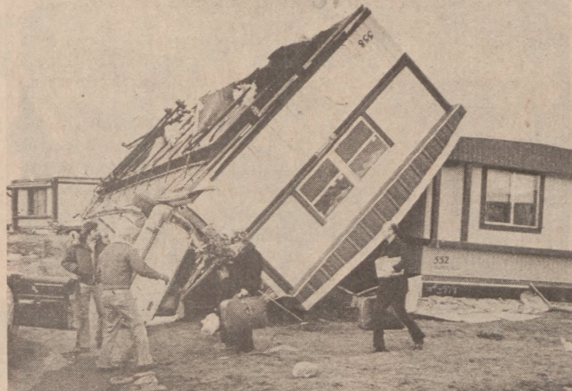
ANCHORAGE, ALASKA. — Silne wiatry dochodzące do 135 mil na godzinę jakie przeszły nad Alaską spowodowały milionowe straty. 15 osób odniosło obrażenia. Na zdjęciu jeden z piętnastu "domów na kółkach" wywróconych przez wiatr.