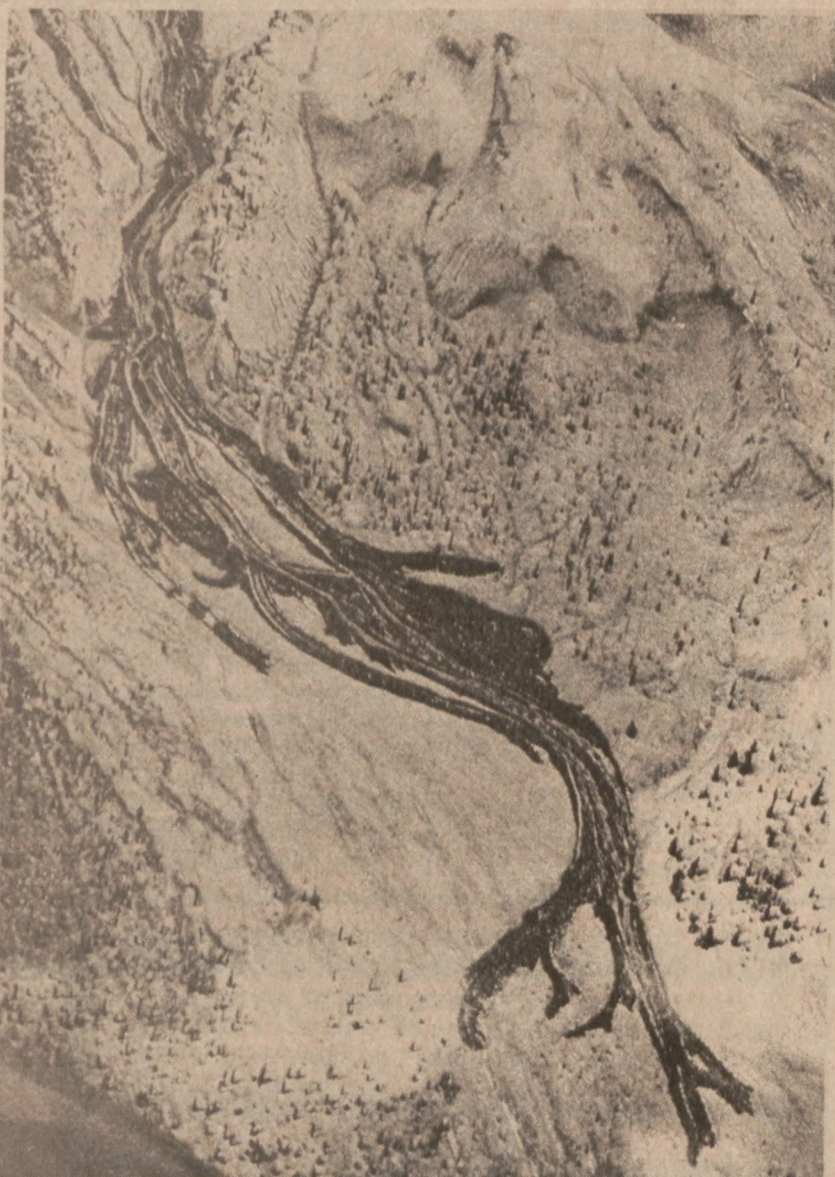
SPIRIT LAKE, WASH. — Wulkan na górze św. Heleny w Stanie Washington wyrzuca nadal popiół z kraterów. Na zdjęciu spływająca po stokach lawa wulkaniczna.

120 mechaników lotniczych linii Ozark zatrudnionych w Chicago odda swe głosy w sprawie podjęcia strajku. Związek Zawodowy Mechaników Samolotowych local 24 z siedzibą w St. Louis proponuje strajk na dzień 5 maja protestując w ten sposób przeciwko przeciągającym się debatom na temat nowej umowy zbiorowej. Wyniki głosowania będą znane dopiero w końcu tego tygodnia, ponieważ część mechaników głosy swe przesłała pocztą.