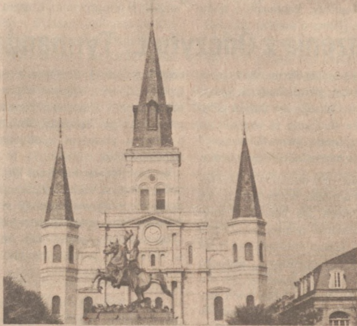
Jackson Square — pomnik generała Andrew Jacksona na tle Katedry

Towarzyszącego ekipie eksperta od spraw Azji Środkowej — Edena Frye — Tass uznała "na podstawie wyglądu" za "bardzo prawdopodobnego agenta CIA". Ponadto Tass dowodzi, że wspomniany program został zrobiony na zarządzenie Zbigniewa Brzezńskiego na podtrzymanie "szowinistycznych, anty-sowieckich nastrojów w USA".