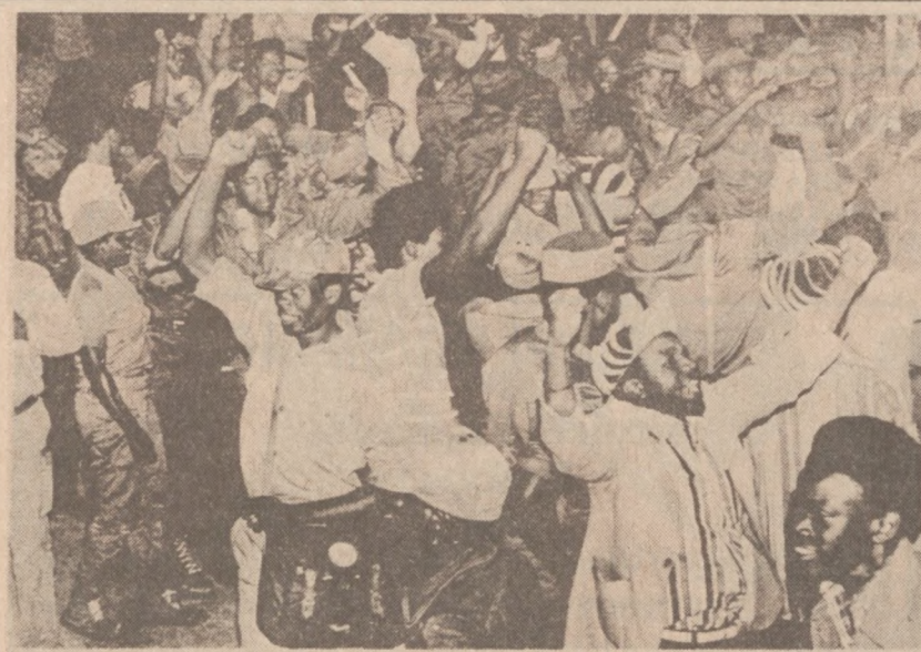
SALISBURY, ZIMBABWE. — Mieszkańcy Rodezji uroczysto obchodzą proklamowanie niepodległej Zimbabwii kończące wieloletnie rządy białej mniejszości.