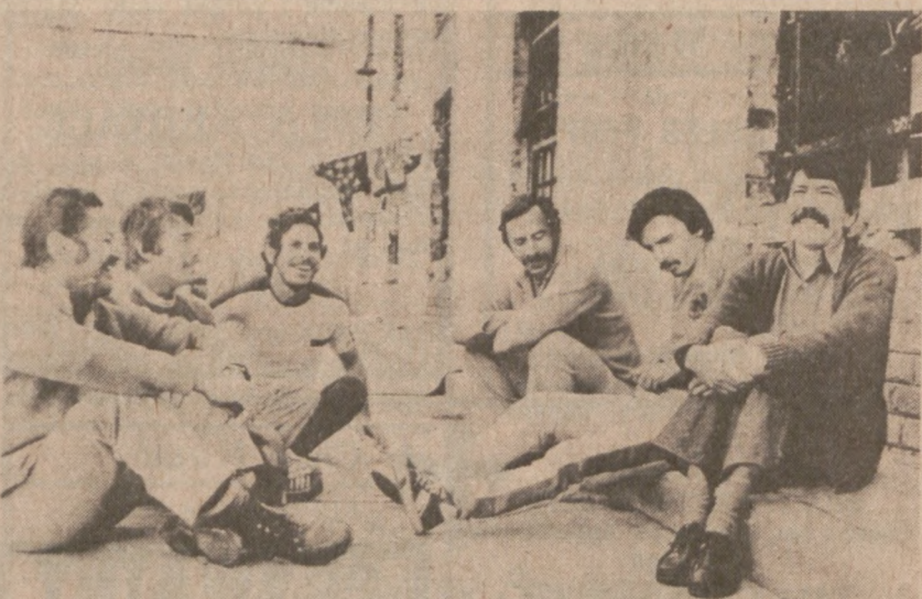
BOGOTA, KOLUMBIA. — Na zdjęciu, wykonanym w początkach kwietnia, sześciu więźniów politycznych przetrzymywanych w więzieniu w stolicy, których uwolnienia domagają się terroryści z ugrupowania M-19 zwalczonego obecnie przez kolumbijski. Członkowie tego ugrupowania okupują gmach ambasady dominikańskiej trzymając 18 dyplomatów jako zakładników.