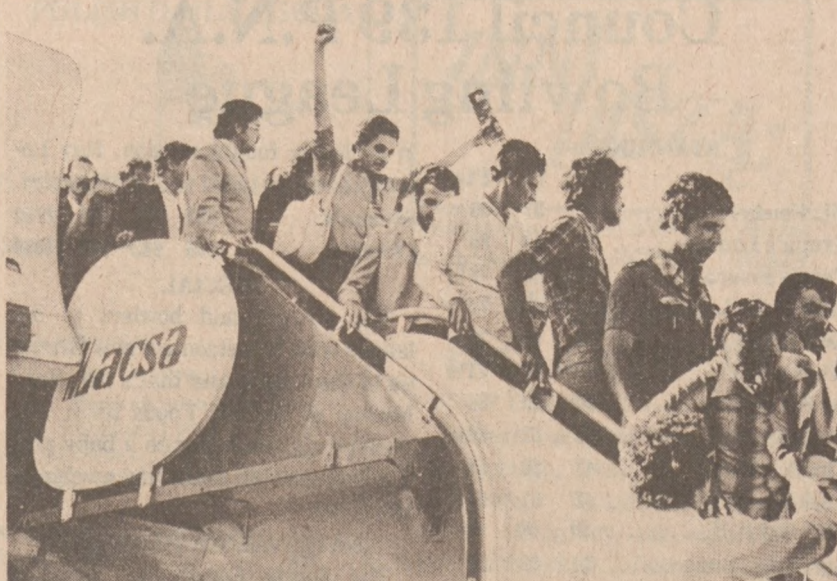
SAN JOSE, KOSTARYKA. — 150 uchodźców kubańskich opuszcza samolot, który przewiózł ich z Hawany. Jest to pierwsza partia uchodźców, którzy przedostali się na terytorium ambasady peruwiańskiej w Hawanie i poprosili o azyl polityczny. Kostaryka przyjęła 250 uchodźców. (UPI)

400 znaleziono w tamtejszych wodach, wśród nich najgroźniejszym jest PCB, stosowany w przemyśle elektronicznym.