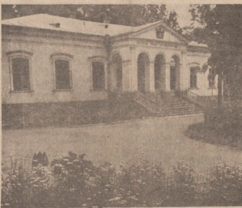
Muzeum Jana Kochanowskiego w Czarnolesie

Dwoje dzieci zostało zabitych, dwanaścioro odniosło rany.