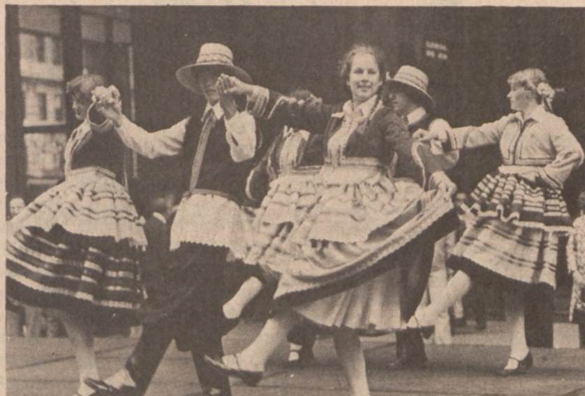
"Trojak" w wykonaniu zespołu "Wesoły Lud" ZPRK

Grupa Polsko-Amerykańskich artystów plastyków zaprezentuje swoje prace na wystawie, która trwać będzie od 1 do 16 maja. Pejzaże, portrety i rzeźby oglądać będzie można w sali wystawowej Daley Center. Wszyscy uczestnicy wystawy, to profesjonalni artyści, którzy studiowali i mieli wystawy w różnych krajach Europy.