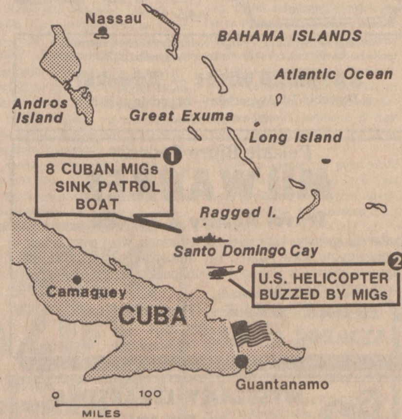
NASSAU, WYSPY BAHAMA. — Mapa sytuacyjna niedawnej napaści Kubańczyków na łódź patrolującą z Wysp Bahama i amerykański helikopter.

“Carter rządzi na Florydzie, w porcie Mariel rządzi Kuba” — brzmiało zdanie z artykułu redakcyjnego. Kapitanowie statków, które znajdowały się w tym porcie, twierdzą jednak, że tamtejsze władze wbrew ich woli nadal zmuszają ich do zabierania ludzi na pokład, kpiąc sobie z propozycji i zarządzeń prez. Cartera. Tylko jednemu statkowi udało się powrócić na Florydę bez uchodźców.