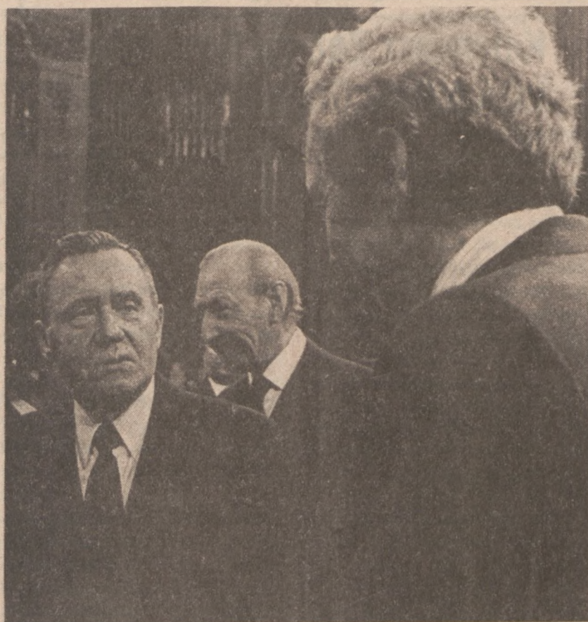
Wiedeń. — Na obchodzie 25 lecia zakończenia okupacji Austrii, doszło do spotkania min. spraw zagr. ZSRR, Andreja Gromyko (po lewej) i sekr. stanu Edmunda Muskie (po prawej). W środku sekr. gen. ONZ Kurt Waldheim.

Dochody 37% Murzynów stanowiących 15% mieszkańców tego 1.5 milionowego miasta znajdują się na poziomie poniżej tzw. wskaźnika głędy. Przeprowadzony ostatnio wśród ludności murzyńskiej sondaż wykazał, że ponad połowa uważa, że konieczność znalezienia zatrudnienia dla uchodźców pogorszy ich sytuację.