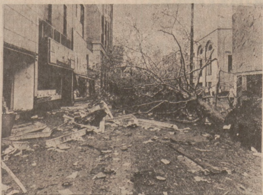
KALAMAZOO, MICH. — Widok jednej z ulic miasta Kalamazoo w stanie Michigan przez które przeszło tornado. W mieście zginęło czworo ludzi.

W ubiegłym sezonie letnim na terenie dróg stanowych w sześciu powiatach w wypadkach spowodowanych zbyt szybką jazdą zginęło 950 osób.