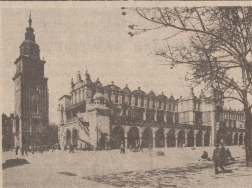
KRAKÓW. — Rynek Główny. Wieża Ratuszowa i Sukiennice.

Następne oskarżenia znajdują się w toku przygotowań.