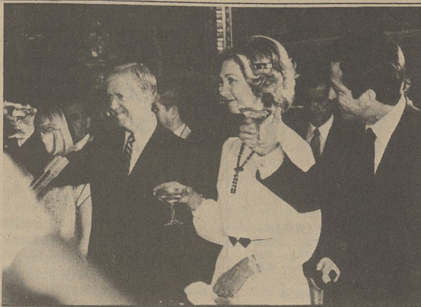
MADRYT. — Prezydent Jimmy Carter w towarzystwie małżonki króla Juan Carlosa, Zofii i premiera Hiszpanii Adolfo Suareza wznoszą toast w czasie przyjęcia w pałacu królewskim Oriente.