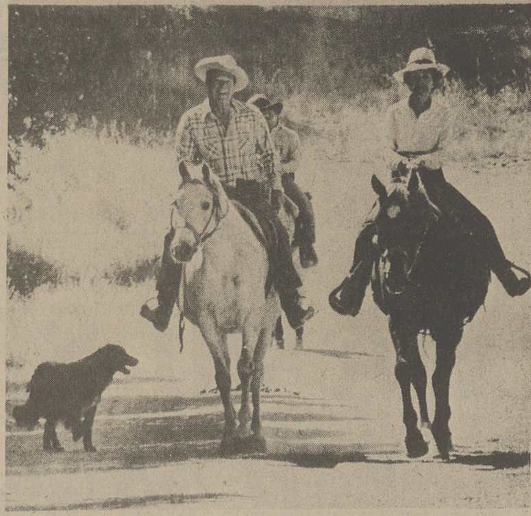
SANTA BARBARA. — Ronald Reagan z małżonką Nancy w czasie przejażdżki konnej na terenie swego rancha w Kalifornii.

Kompania ta stwierdziła, że ogrzewanie przeciętnego domu gazem kosztuje rocznie $587, gdy przy ogrzewaniu ropą trzeba zapłacić $1,425, a przy ogrzewaniu elektrycznością $1,322.