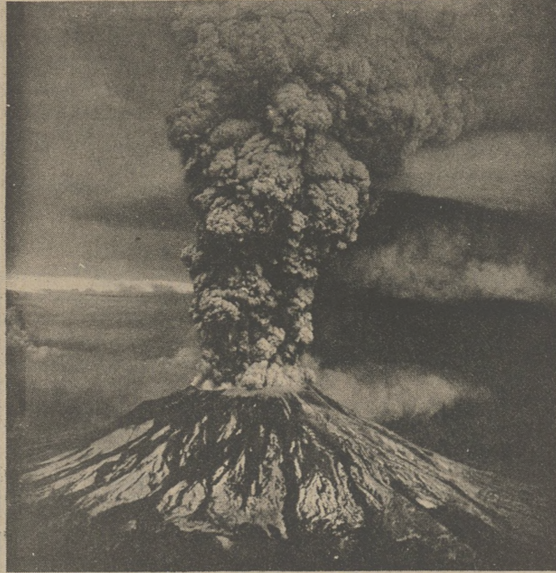
Zdjęcie zrobione dla Instytutu Geologii przedstawia moment wybuchu wulkanu św. Helena w dniu 18 maja.

Washington odbywał właśnie karę za współudział w morderstwie córki. Wczoraj Ława Przysięgłych uznała go winnym śmierci syna.