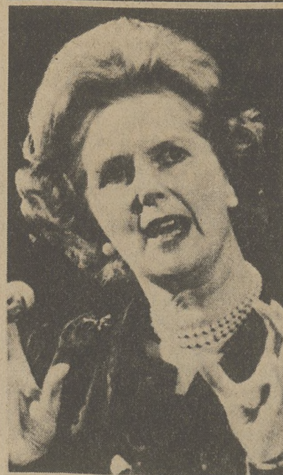
LONDYN. — Premier W. Brytanii p. Margaret Thatcher podjęła kroki zmierzające do opanowania inflacji, która szczególnie rujnuje gospodarke Anglii.