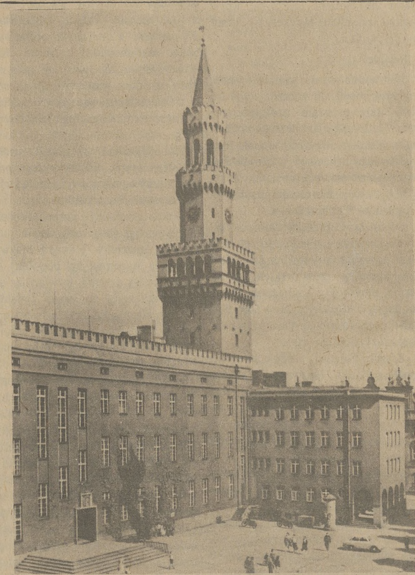
OPOLE — Ratusz

Reprezentanci Izraela powiedzieli, że sprawę Palestyny mogą rozstrzygać wyłącznie w bezpośrednich negocjacjach ze swoimi arabskimi sąsiadami.