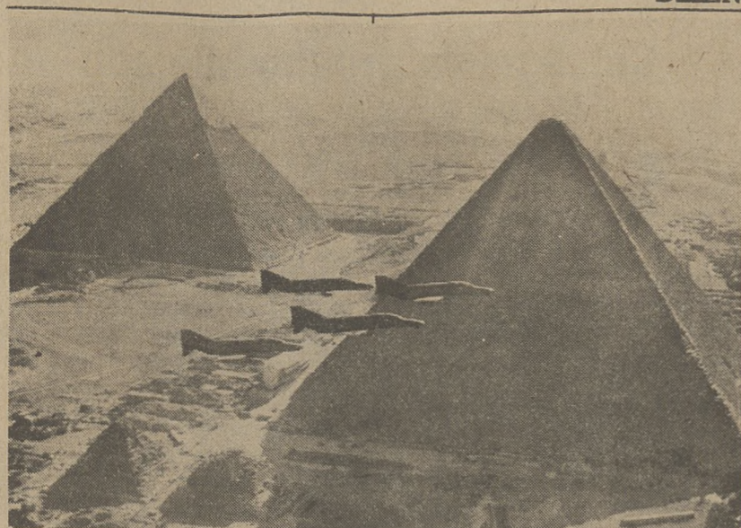
KAIR. — Szwadron amerykańskich samolotów F-4E Phantom II bierze udział w ćwiczeniach lotniczych wojsk egipskich. Ćwiczenia potrwać do połowy września.