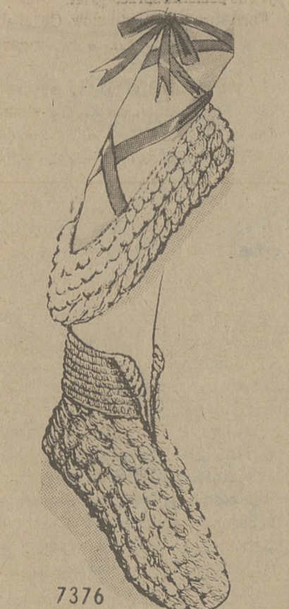
7376 by Alice Brooks

Slide into comfort in these attractive easy-fit slippers. Be dollar-wise! Crochet packable, flexible ballet or cuffed slippers of 3 strands of bedspread cotton used together. Very easy! Pattern 7376, directions, sizes S, M, L included. $1.75 for each pattern. Add 50¢ each pattern for first-class airmail and handling. Send to: Alice Brooks Needlecraft Dept. 263 Polish Daily Zgoda Box 163, Old Chelsea Sta., New York, NY 10011. Print Name, Address, Zip, Pattern Number. EXCITING! New 1980 NEEDLE-CRAFT CATALOG with over 170 designs in great variety of crafts. 3 free patterns incide. Send $1.00 132-Quilt Originals ..... $1.50 131-Add a Block Quilts ..... $1.50 130-Sweaters-Sizes 38-56 ..... $1.50 129-Quick/Easy Transfers ..... $1.50 128-Patchwork Quilts ..... $1.50 127-Alphans 'n' Doodles ..... $1.50 126-Crafty Flowers ..... $1.50 125-Petal Quilts ..... $1.50 124-Gifts 'n' Ornaments ..... $1.50 123-Stitch 'n' Patch Quilts ..... $1.50 122-Stuff 'n' Puff Quilts ..... $1.50 121-Pillow Show-Offs ..... $1.50 120-Crochet a Wardrobe ..... $1.50 119-Flower Crochet ..... $1.50 118-Crochet with Squares ..... $1.50 116-Nifty Fifty Quilts ..... $1.50 115-Ripple Crochet ..... $1.50 114-Complete Alphans ..... $1.50 112-Prize Alphans ..... $1.50 107-Instant Sewing ..... $1.50 105-Instant Crochet ..... $1.50 102-Museum Quilts ..... $1.50 101-Quilt Collection ..... $1.50