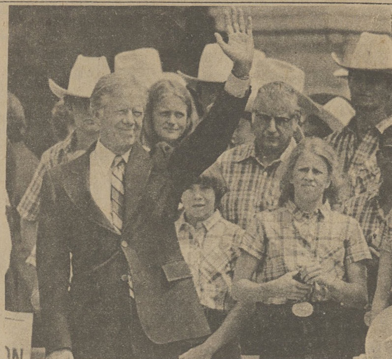
WASHINGTON. — Prez. Jimmy Carter pozdrawia członków amerykańskiej drużyny olimpijskiej, którym Kongres przyznał specjalne złote medale. Amerykanie nie uczestniczyli w olimpiadzie moskiewskiej protestując w ten sposób przeciwko agresji sowieckiej na Afganistan.

Siłownia Quad City mieści się w miasteczku Cordova nad rzeką Mississippi, w rejonie zamieszkałym przez około 350.000 mieszkańców.