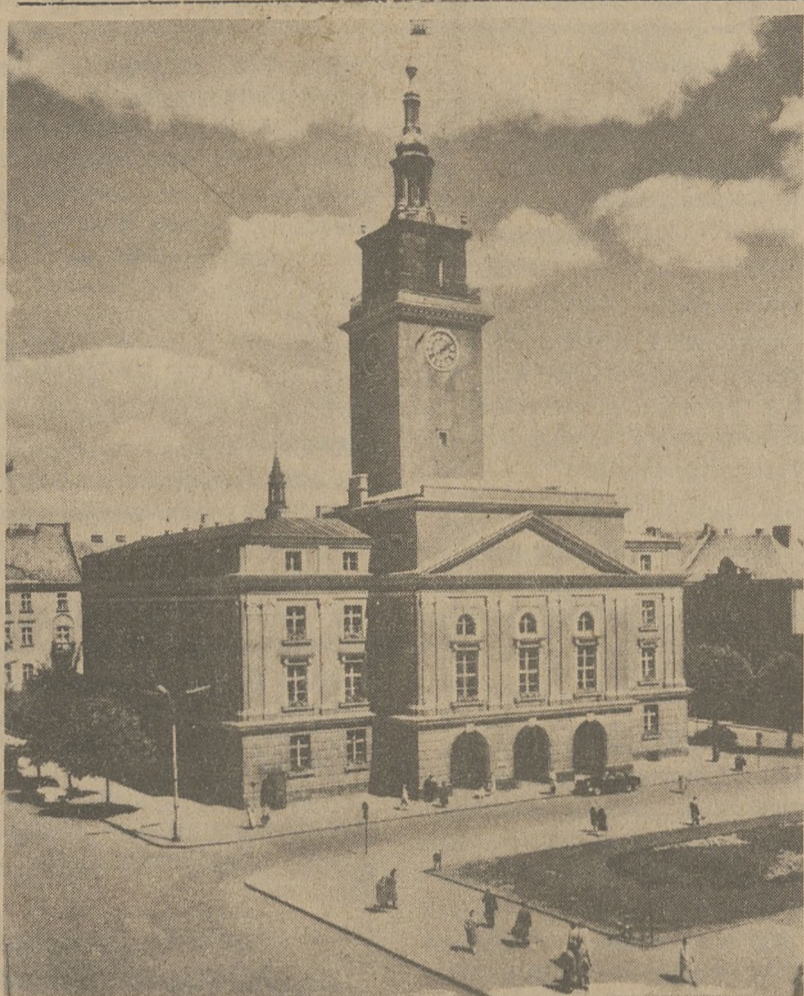
KALISZ. — Ratusz

Pogłoski na temat oparte były na oświadczeniu wicepremiera Simhy Ehriha, który powiedział, że w rozmowie z nim premier Begin zainteresował się koncepcją przyspieszenia przysioroczných wyborów na maj lub czerwiec. Dla zrealizowania tej koncepcji konieczną byłaby dymisja gabinetu.