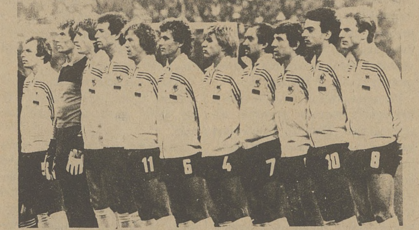
REPREZENTACJA NIEMIEC ZACHODNICH, która zdobyła mistrzostwo Europy, bijąc w finałowym spotkaniu Belgię 2:1. Stoją od lewej do prawej: Bernhard Dietz, Norbert Nigbur, Manfred Kaltz, Bernd Cullmann, Harald Nickel, Rainer Bonhof (obecnie występujący w Walencji), Bernd Foester, Ulrich Stielicke (obecnie grający w Barcelonie), Klaus Fischer, Hansi Mueller i Karl-Heinz Rummenigge.