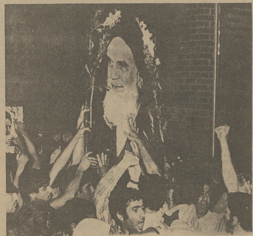
NEW YORK. — Przed siedzibą Shih Islamic Center w New Yorku zwolennicy reżimu ayatollah Khomeiniego protestowali z powodu aresztowania Irańczyków, którzy w ubiegłym tygodniu urządzili demonstrację przed Białym Domem w Washingtonie. (UPI)

Policja zatrzymała 15-letnią dziewczynę, która podejrzana jest o zastrzelenie własnej matki. Ze względu na młody wiek dziewczyny nie ujawniono jej nazwiska.