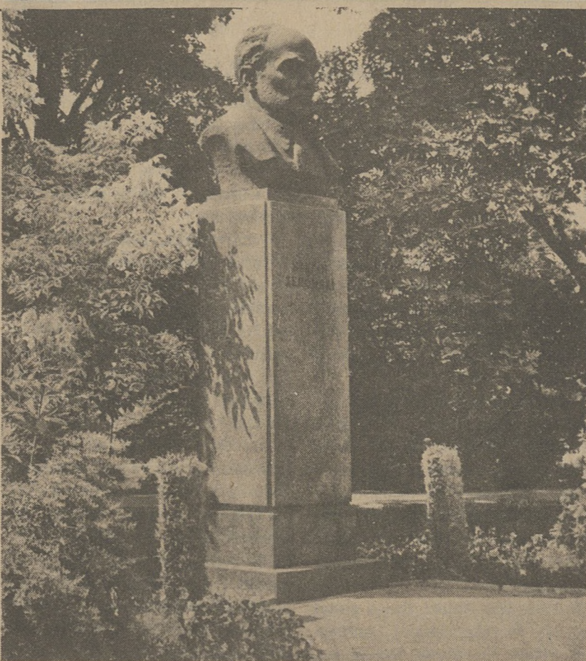
KIELCE — Pomnik Stefana Żeromskiego

London. (UPI) — Pierwsze w tym tygodniu notowania giełdowe wykazują nikłe, dwustronne wahania w kształtowaniu się kursu dolara. Cena złota spadła o dolara na uncji w Londynie, o $10 w Zurichu.